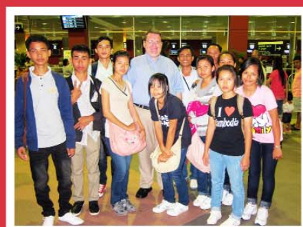
សិស្សវិទ្យាល័យសន្តប្រុងស្ទីវទៅ ចារាំងដើម្បីទស្សនកិច្ចសាលាដៃគូ