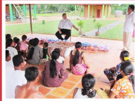
លោកអភិបាលចែកអំណោយ ដល់ប្រជាជននៅភូមិសុខសាន្ត ឃុំគូស ស្រុកត្រាំកក់ ខេត្តតាកែវ