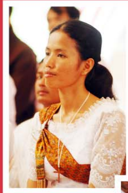
ពិធីសប្បុរសភាពប្រណិធានជំហានទីមួយរបស់បងស្រីសៅនី ចូលក្នុងក្រុមបងស្រីឧបការគុណ នៅថ្ងៃទី០៨ តុលា ២០១១