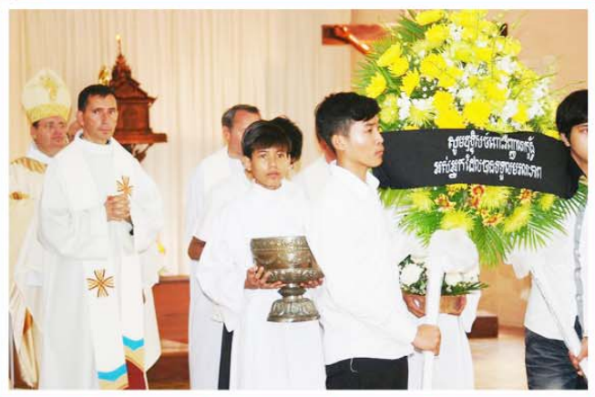
ពិធីបុណ្យផ្តាំរបស់ព្រះសហគមន៍នៅថ្ងៃទី២៧ កញ្ញា នៅព្រះវិហារសន្តយ័សៃប (ធុរាតូច) ភ្នំពេញ