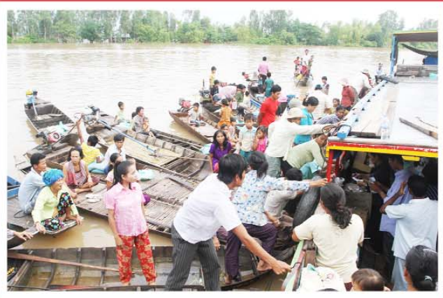
ក្រុមបងប្រុស ក្រុមបងស្រីមេត្តាករុណា និងលោកបូជាចារ្យព្រះសហគមន៍កោះសំពៅ ចូលរួមចែកអំណោយកាលពីថ្ងៃទី០៦-០៨ តុលាកន្លងទៅ នៅស្រុកព្រះស្តេច ខេត្តព្រៃវែង។