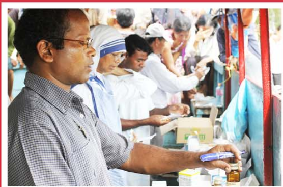
ប្រជាជនដែលរងគ្រោះ ដោយទឹកជំនន់ទទួល អំណោយដូចជា ម្ហូប ថ្នាំពេទ្យ មុន និងដី