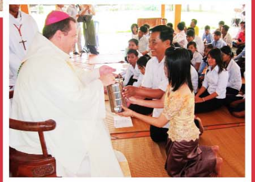
ពិធីបុណ្យផ្តាំបិណ្ឌនៅព្រះសហគមន៍ ចំការទៀង។