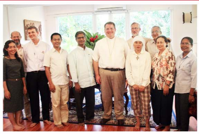
ប្រជុំព្រះកម្មីនៅទីសង្កាត់របស់លោកអភិបាលភូមិភាគភ្នំពេញ។