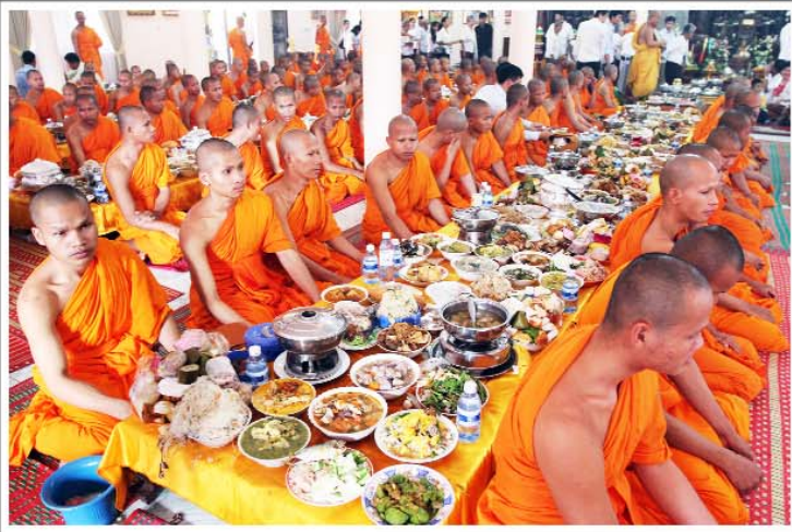
ពិធីបុណ្យភ្ជុំបិណ្ណប្រពៃណីជាតិខ្មែរកាលពីថ្ងៃទី២៦-២៨ តុលា ប្រជាជនខ្មែរយកចង្កាន់ទៅតាមវត្តអារាមនានា នៅទូទាំងប្រទេស ទោះបីមានការរំខានពីទឹកជំនន់ក៏ដោយ។