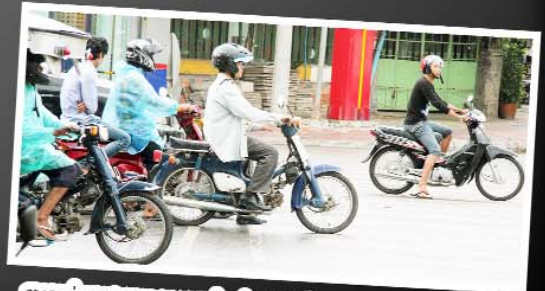
ការលប់ចតដោយមានសណ្តាប់ធ្នាប់នៅមុខភ្លើងស្តុប បង្ហាញពីអាកប្បកិរិយាថ្លៃថ្នូររបស់ប្រជាពលរដ្ឋដែលមានវប្បធម៌ និងសេចក្តីថ្លៃថ្នូរ និងចេះគោរពច្បាប់។