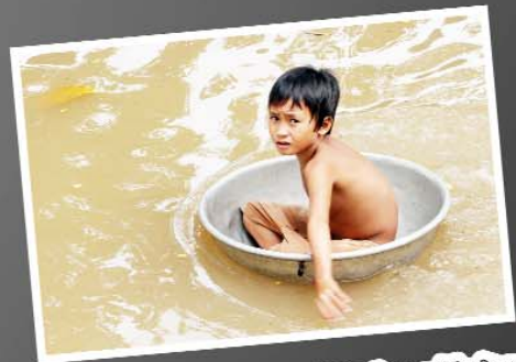
នៅពេលទឹកជំនន់ពិតកុហក ប្រយោមមុខខ្ពស់បំផុតនិងការយល់ទឹក និងការប៉ះពាល់សុខភាព។ ដូច្នេះសាច់ញាតិចាស់ទុំគួរប្រុងប្រយ័ត្នបំផុតចំពោះពួកគេ។