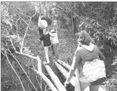
លោកម៉េន មាច និងតំណាងអង្គការដៃគូកំពុងសិក្សាស្វែងយល់ក្នុងព្រៃអភិរក្ស

សព្វថ្ងៃនេះនៅទីណាក៏ពួកស្រីតែពាក្យថា អភិរក្សដែរសូម្បីតែនៅតាមទីជនបទ។ ប៉ុន្តែតើមិត្តអ្នកអានយល់អ្វីខ្លះពីពាក្យនេះ? ហើយថា តើការអភិរក្សនេះ គេដំណើរការដោយរបៀបណា? គេអនុវត្តយ៉ាងម៉េច? អ្នកនាំសារសូមរំលែកនាំមិត្តអ្នកអានឱ្យជួបជាមួយនិងលោកមាច ម៉េន អ្នកសម្របសម្រួលនៃអង្គការបណ្តាញការពារទន្លេសេសាន សេកុង និងស្រែពក ក្នុងខេត្តរតនគិរី។