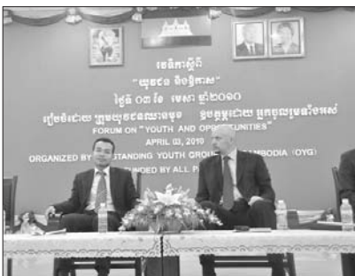
លោកព្រាប កុល ក្នុងវេទិកាយុវជនមួយ

តើស្លឹកឈើពិតជាត្រូវគ្រុះមិននាយពីគល់ឬ? តើកូនកសិករនៅតែជាកសិករឬ? ដើម្បីដឹងចម្លើយនេះ អ្នកនាំសារសូមណែនាំឱ្យមិត្តអ្នកអានជួបជាមួយនិងលោកព្រាប កុល ដែលមានអតីតភាពជាកូនកសិករមួយរូបមកពីខេត្តស្វាយរៀង។ តែបច្ចុប្បន្ននេះ លោកជាឯកអគ្គរាជទូតសន្តិភាពមួយរូប។