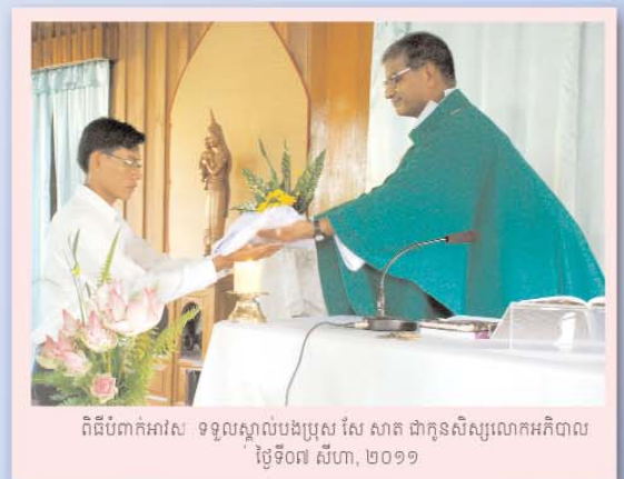
ពិធីបំបាក់អាវស ទទួលស្គាល់បងប្រុស សែ សាត ជាកូនសិស្សលោកអភិបាល ថ្ងៃទី០៧ សីហា, ២០១១