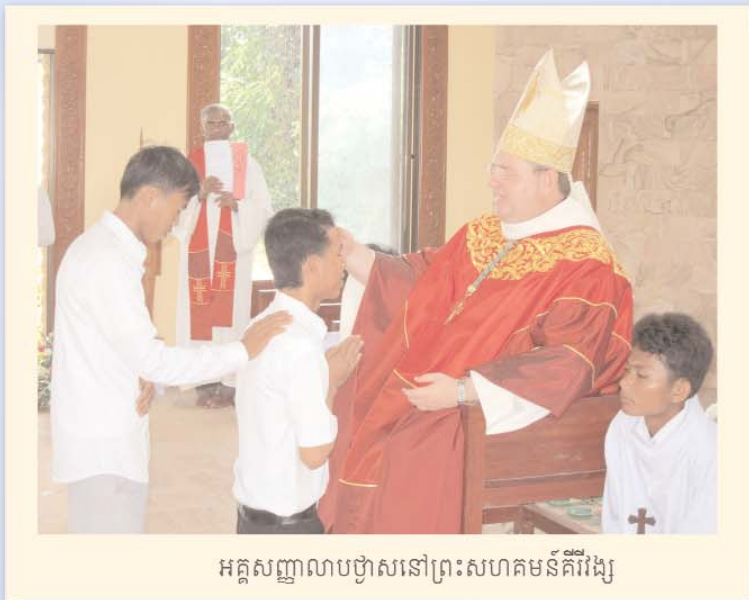
អគ្គសញ្ញាលាបថ្វាសនៅព្រះសហគមន៍គីវ៉ែង្ស