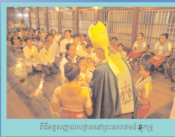
ពិធីអគ្គសញ្ញាលាបថ្វាសនៅព្រះសហគមន៍ ឆ្នុកទ្រូ