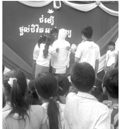
យុវជនព្រះសហគមន៍ភូមិថ្មីសម្តែងល្ខតកាយវិការតាមព្រះ គម្ពីរអំពីការមានព្រះធនឡើងវិញដំរុះរៀងរបស់ព្រះគ្រីស្ទ