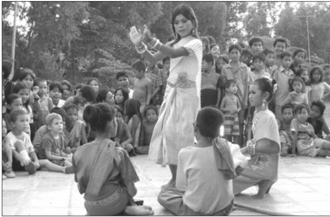
ក្រុមចម្រើនប្រពៃណី