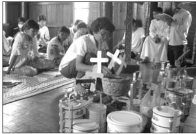
លើគ្នាគ្រោងដាក់ឈ្មោះបុព្វការីដើម្បីប្រាប់ដល់ព្រះជាម្ចាស់

គ្រីស្ទបរិស័ទកាតូលិកនៃព្រះសហគមន៍ ភូមិថ្មី នៅភូមិភាគកាតូលិកកំពង់ចាមបាន ជួបជុំគ្នាកាល ពីថ្ងៃអាទិត្យ ទី២០ កញ្ញា