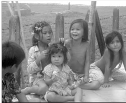
កុមារនៅក្នុងភូមិចូលរួម វិករាយ និងចូលចិត្តយ៉ាងខ្លាំង ចំពោះពិធីបុណ្យនៅព្រះវិហារព្រះសហគមន៍កាតូលិកភូមិថ្មី