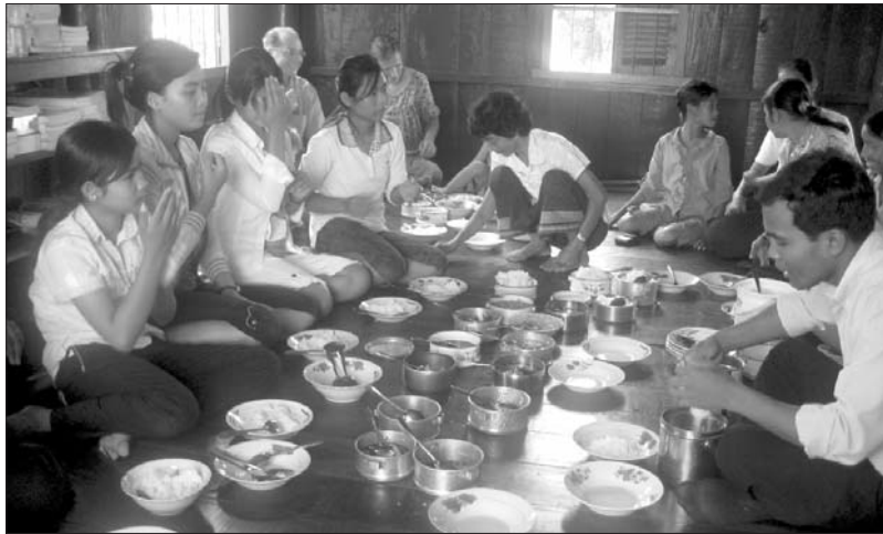
ការបរិភោគអាហាររួមគ្នាជាភាគរួមនៅក្នុងពិធីបុណ្យរបស់គ្រីស្ទបរិស័ទភូមិថ្មី និងអ្នកទូទៅដោយមិនមានការប្រកាន់