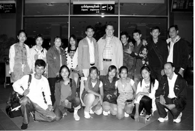
សិស្សានុសិស្ស សាលាសន្តហ្វ្រង់ស័រ

រវាងសាលាទាំងនេះទៅលើ បច្ចេកទេស ការអប់រំ កម្មវិធីសិក្សា និងរបៀបចាត់ចែងគ្រប់គ្រង ផង ដែរ ជាងនេះទៅក៏ដើម្បីផ្តល់ឱកាសដល់សិស្សនៃ សាលានិមួយៗបានធ្វើការសិក្សាអំពីវប្បធម៌វា ង ប្រទេសទាំងពីរគឺកម្ពុជា និងបារាំង។ សូមបញ្ជាក់ ថា កន្លងមកសាលាវិទ្យាល័យសន្តហ្វ្រង់ស័រក៏ធ្លាប់ ធ្វើទស្សនកិច្ចទៅកាន់សាលាជាដៃគូរបស់ខ្លួនដូច ជានៅជប៉ុន និងសិង្ហបុរី នឹង ក ៏ ច ា ន ទ ទ ួ ល រ ូ វ ដ ំ ណ ើ រ ទ ស ្ស ន កិ ច្ច របស់សាលាទាំងនោះវិញដែរ។ ស ព ្រ ៃ ថ្ងៃ រ េ ន ៖ វិ ទ ្យ ា ល័យ ស ន ្ត ហ ្វ ្រ ង់ ស័រ ជា សាលា