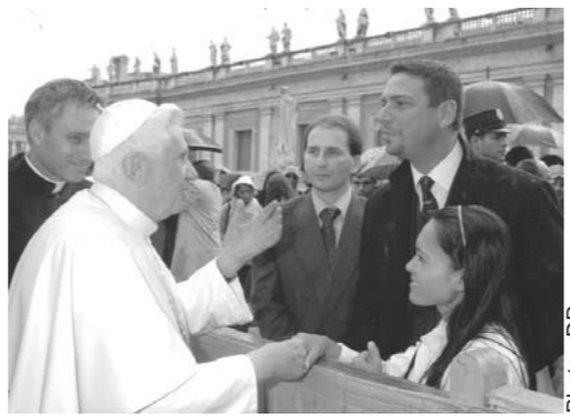
សម្តេចប៉ាបបេណេឌិកទី១៦ កំពុងស្ទាតមន៍គណៈប្រតិភូ នៃប្រទេសកម្ពុជាពេលទៅដល់អ៊ីតាលី

យុទ្ធនាការ នៅប្រទេសកម្ពុជាយើង ។ សម្តេចប៉ាប បេណេឌិក ទី១៦ ក៏មានប្រសាសន៍ លើកទឹកចិត្ត ឱ្យបន្តសកម្មភាពនេះតទៅរហូតបានជោគជ័យ ។ ព្រះអង្គគាំទ្រទាំងស្រុងលើសកម្មភាពនេះ ។ នៅក្នុងកិច្ចប្រជុំជាមួយក្រសួងការបរទេសអ៊ីតាលី កញ្ញាបានខិតខំយ៉ាងអស់ពីសមត្ថភាពដើម្បីបង្ហាញ នូវទុក្ខលំបាករបស់ជនរងគ្រោះដោយសារតែគ្រាប់ មីន ជាពិសេសនៅប្រទេសកម្ពុជា ។ យុវតិរចនា ជន ពិការវ័យ២៤ឆ្នាំរូបនេះ បន្តថា កញ្ញាបានអំពាវនាវ សុំឱ្យរដ្ឋាភិបាលអ៊ីតាលី បន្តផ្តល់ជំនួយក្នុងការដោះ កំចាត់មីននៅប្រទេសកម្ពុជា និងជួយជនរងគ្រោះ ដោយសារមីនព្រោះតែសង្គ្រាមជិតបិទសវត្សរ៍នេះ ផងដែរ ។ លើសពីនេះកញ្ញាក៏បានអំពាវនាវប្រទេស ធំៗទាំងអស់ឈប់ផលិតគ្រាប់មីនតទៅទៀត ។