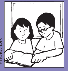
សូម្បីប្អូនៗ កន្លងមកនេះ យើងបានប្រារព្ធបុណ្យព្រះយេស៊ូទទួលព្រះជន្មរីករឿង ពីព្រះបិតាបន្ទាប់ពីព្រះ

(អ្នកនាំសារ ខែឧសភា ២០០៩ - អធិប្បាយព្រះបន្ទូលថ្ងៃអាទិត្យ / លោកបូជាហាវ អូមែ ហ្សឺរ៉ាល់មូ)