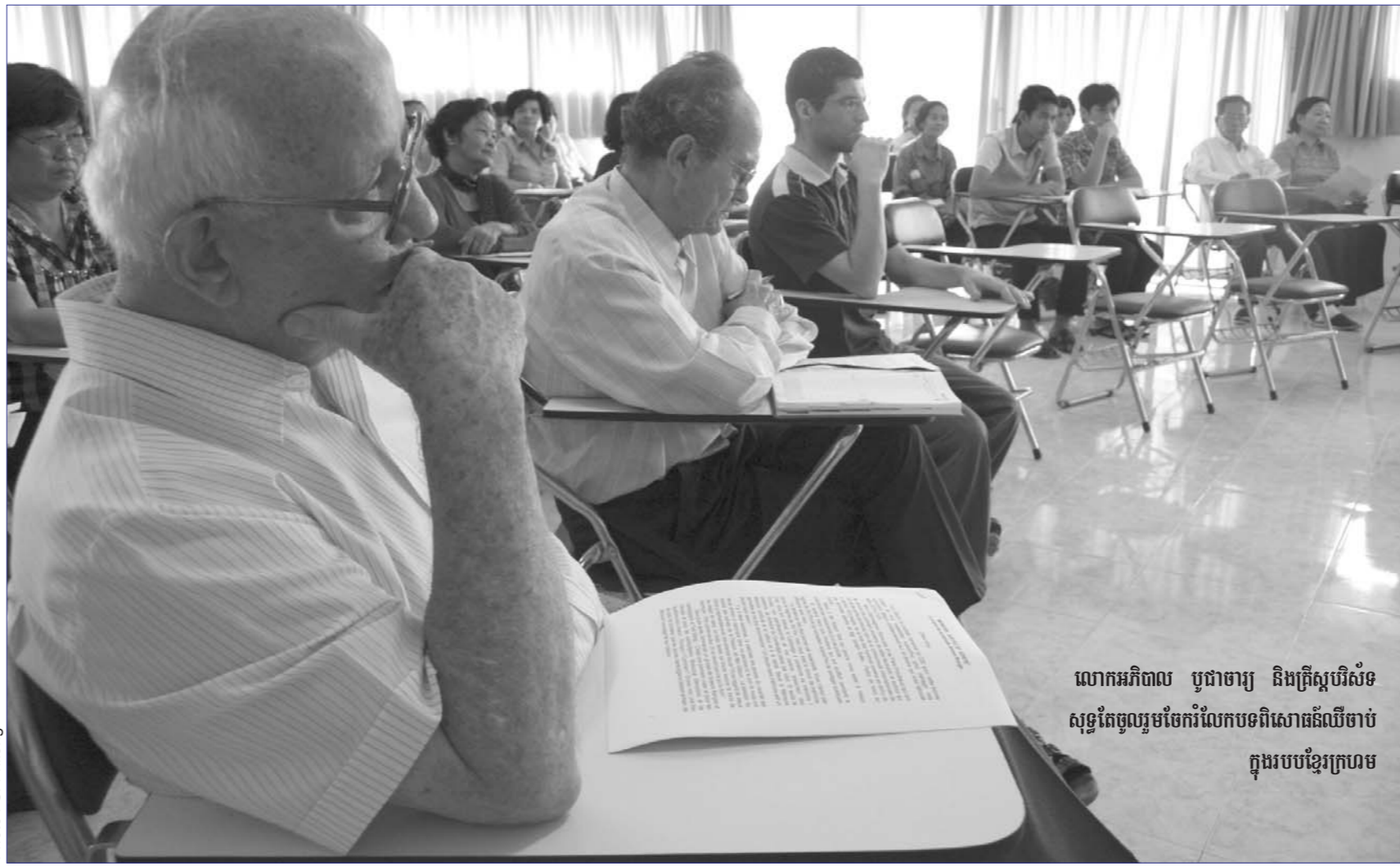
លោកអភិបាល បូជាចារ្យ និងគ្រីស្ទេរីស៍ មនុស្សតែមួយរូបចែករំលែកបទពិសោធន៍លើចាប់ក្នុងរបបខ្មែរក្រហម

ក្នុងចំណោមជនរងគ្រោះ ពីរបបខ្មែរក្រហម ដែលកំពុងតែតាមដានលើដំណើរការ របស់សាលាក្តីខ្មែរក្រហម សាសនិកនៃសហគមន៍កាតូលិក ដែលគឺជាជនរងគ្រោះដែរនោះ កំពុងតែតាមដានលើដំណើរការរបស់សាលាក្តីនេះយ៉ាងយកចិត្តទុកដាក់ផងដែរ ។ ការឈឺចាប់របស់ពួកគាត់ នៅក្នុងរបបខ្មែរក្រហម បានត្រូវបង្ហាញឡើងតាមរយៈវេទិកាមួយ ដែលរៀបចំឡើង ដោយការិយាល័យប្រព័ន្ធផ្សព្វផ្សាយព័ត៌មានព្រះសហគមន៍កាតូលិកនៅទីក្រុងភ្នំពេញ កាលពីចុងខែមីនា ឆ្នាំ២០០៩កន្លងទៅនេះ ។ បើយោងទៅតាមអ្វីដែលពួកគាត់បានបង្ហាញនោះ សហគមន៍អ្នកកាន់សាសនាកាតូលិកទាំងអស់ក៏ដូចជាប្រជាពលរដ្ឋកម្ពុជាទូទៅដែរ គឺសុទ្ធតែត្រូវបានរងគ្រោះពីរបបខ្មែរក្រហម ។ ពួកគាត់បានត្រូវពួកខ្មែរក្រហមជម្លៀសចេញពីផ្ទះសំបែង ក្រោយពេលដែលពួកគេបានដំណើរការកាន់កាប់ទីក្រុងភ្នំពេញ ។ ពួកគាត់បានត្រូវខ្មែរក្រហមបង្ខំឱ្យធ្វើពលកម្មហួសកម្លាំង ហូបមិនឆ្អែត ធ្លាក់ខ្លួនឈឺគ្មានថ្នាំសង្កូវដើម្បីព្យាបាល ទទួលទារុណកម្ម សម្លាប់ និងត្រូវបានបង្ខំឱ្យបោះបង់ជំនឿ ដូចជាអ្នកកាន់ពុទ្ធសាសនា ព្រមទាំង សាសនាដទៃទៀតដែរ ។