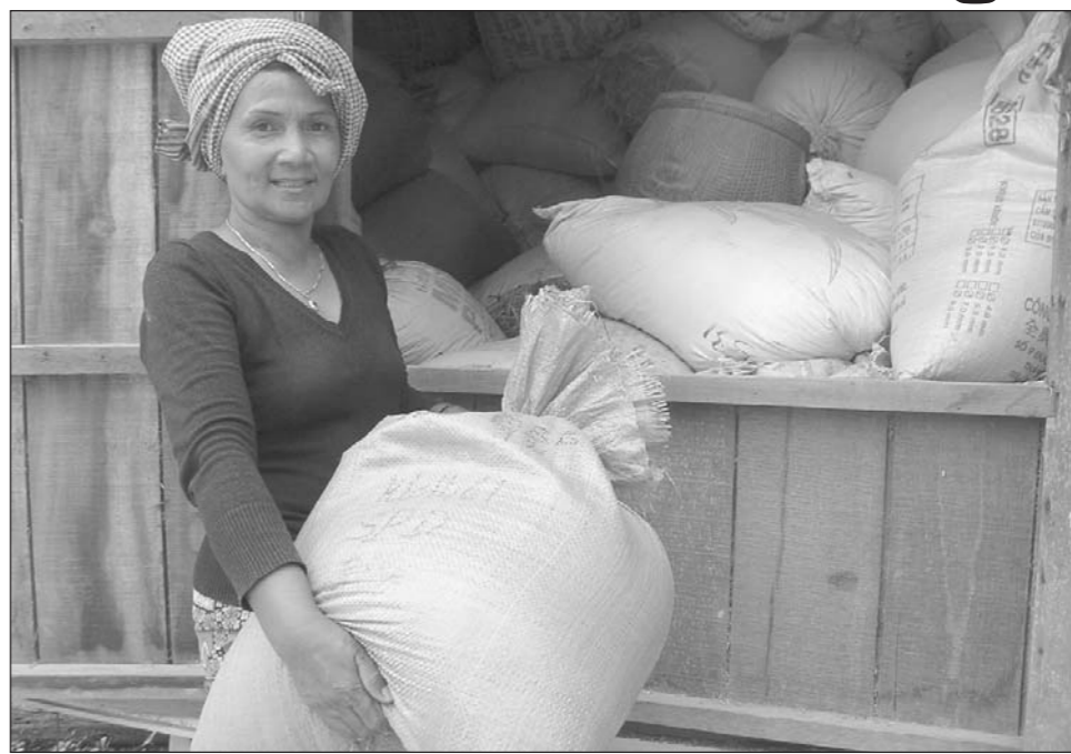
នៅភូមិព្រះនាគ ជម្រកធ្វើពិធីដែលជួយឧបត្ថម្ភសម្រាប់ធ្វើធនាគារស្រូវនៅក្នុងភូមិ និងអ្នកចាត់ចែងអង្គការជម្រក