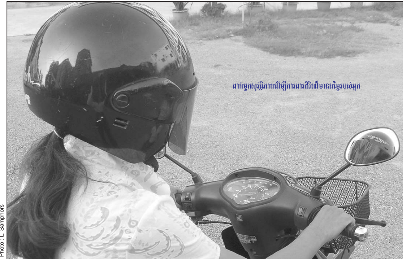
ពាក់មួកសុវត្ថិភាពដើម្បីការពារជីវិតដ៏មានតម្លៃរបស់អ្នក