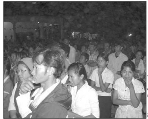
ប្រជាជនយ៉ាងច្រើនកុះករមកចូលរួមអំណរ និងថ្ងៃបុណ្យព្រះយេស៊ូប្រសូត ដែលបង្ហាញអំពីសាមគ្គីភាពរវាងគ្រីស្ទបរិស័ទ និងពុទ្ធបរិស័ទ

នេះគឺដើម្បីផ្តល់សេចក្តីសុខ ឱ្យប្រជាជនទាំងអស់ ។ សម្រាប់គ្រីស្ទបរិស័ទ និងពុទ្ធបរិស័ទរួមជាមួយគ្នា នេះបង្ហាញថា នេះជារបៀបមួយដែលយើងបង្កើតពិភពលោកថ្មី ដែលទាំងអស់គ្នា មានការយល់ចិត្តគ្នា និងគោរពគ្នាទៅវិញទៅមក ។ សម្រាប់បុណ្យអូស៊ីវីយេនេះ ព្រះសហគមន៍ចំការឡើង ក៏មានរៀបចំពិធីអភិបូជា និងកម្មវិធីសិល្បៈដូចជាការសម្តែងល្ខោនរឿងព្រះយេស៊ូប្រសូត រាំបំប្លែង រឿងរាមកេរ្តិ៍ រឿងកំប្លែង កំសត់ និងមានការប្រគុំតន្ត្រីសម័យពិក្រមសិល្បៈមកពីស្រុកដូនតីខេត្តតាកែវ ។ លើសពីនេះ ក៏មានកម្មវិធីចាប់ឆ្កែ ដើម្បីរកថវិកាជួយសង់ផ្ទះជូនអ្នកក្រីក្រផងដែរ ។