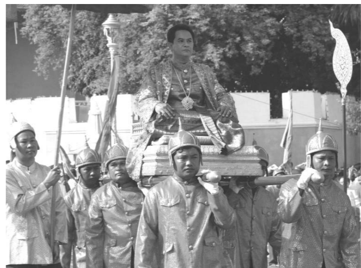
អ្នកអម្ចាស់នរោត្តម សីហមុនី ត្រូវបាន សព្វព្រះរាជហឫទ័យ ក្រៀមតាំងដោយ ព្រះករុណា ព្រះ មហាក្សត្រ ធ្វើជា ស្តេចនាគក្នុងព្រះរាជ ពិធីច្រត់ព្រះនង្គ័លដ៏ ឧដុង្គឧត្តម។ ព្រះ អម្ចាស់កំពុងត្រូវបាន ដង្ហែទៅកាន់ព្រះស្រែ ក្នុងពេលដំណើរពិធី