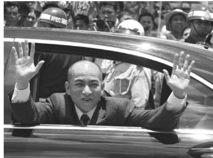
ព្រះបាទសម្តេច ព្រះ បរមនាថ នរោត្តម សីហមុនី ព្រះ មហាក្សត្រនៃព្រះ រាជាណាចក្រកម្ពុជា យាងមកធ្វើជាព្រះ អធិបតីភាពក្នុងព្រះ រាជពិធីច្រត់ព្រះ នង្គ័លឆ្នាំ២០០៧។ ព្រះអង្គលើកព្រះហស្ត ស្វាគមន៍ប្រជារាស្ត្រ របស់ព្រះអង្គ។