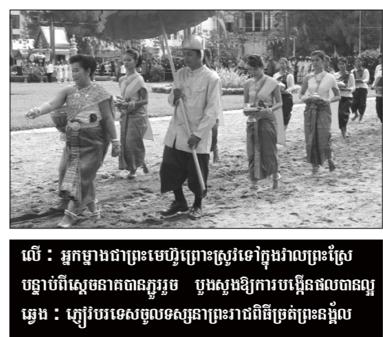
លើ : អ្នកម្នាងជាព្រះមេហ្វិព្រោះស្រូវទៅក្នុងវាលព្រះស្រែ បន្ទាប់ពីស្តេចនាគបានក្លាយរួច បូងសូងឱ្យការបង្កើនផលបានល្អ ឆ្វេង : ស្រូវបរទេសចូលទស្សនាព្រះរាជពិធីច្រត់ព្រះនង្គ័ល