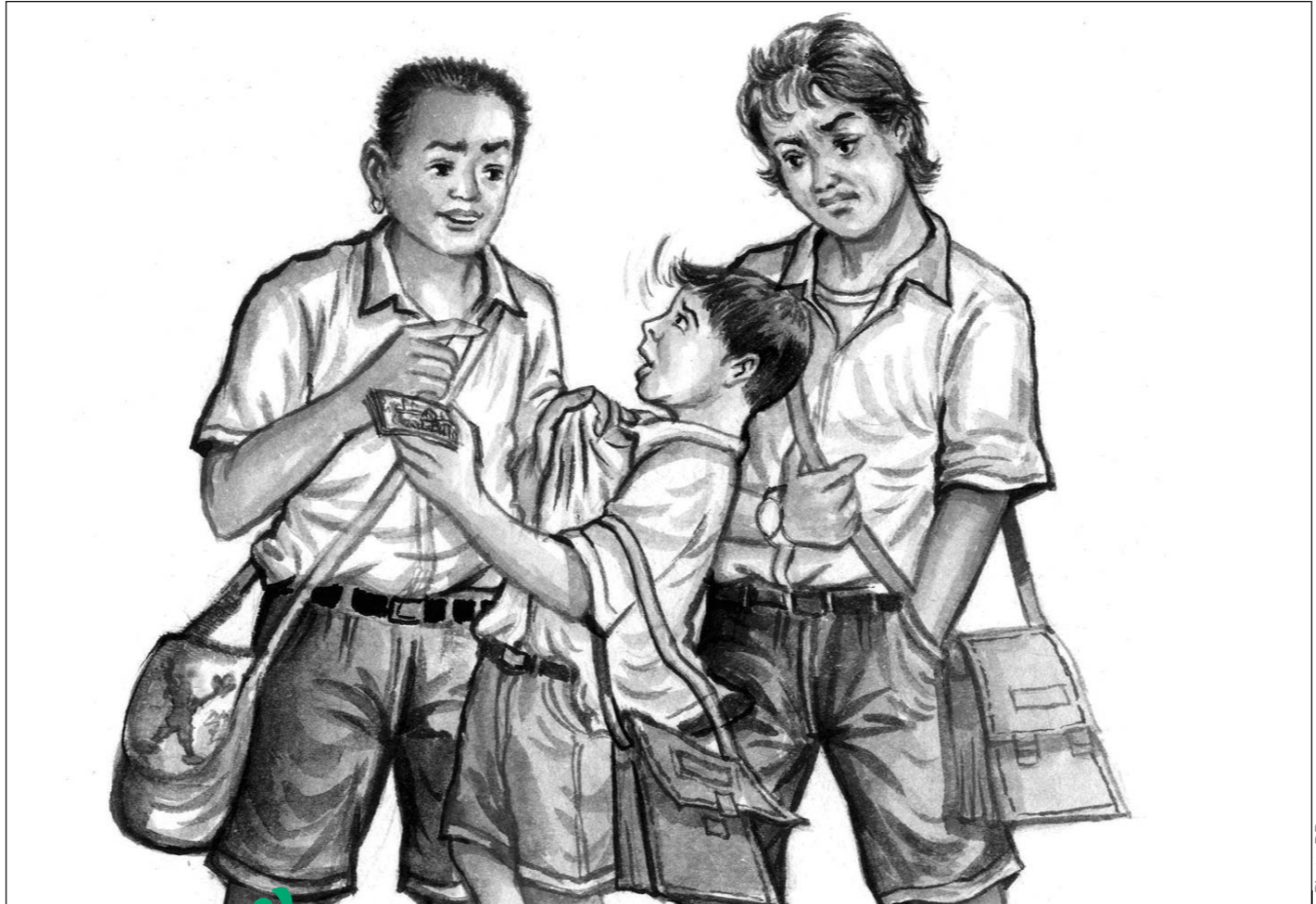
ការសម្តែងទារុណយុវក្មេងតូចៗរបស់យុវជនហៅបងព័ គឺធ្វើអសីលធម៌