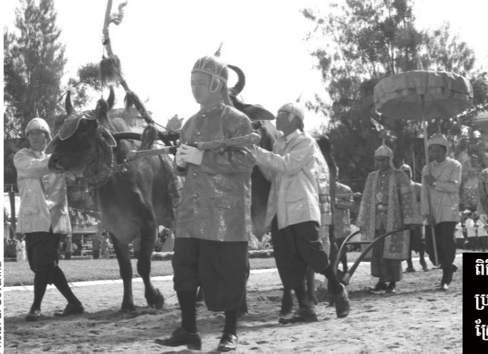
ពិធីប្រគល់ព្រះនង្គ័ល ប្រកាសអំពីរដ្ឋវិធី រៀបចំសម្រាប់ស្រែដល់កសិករ