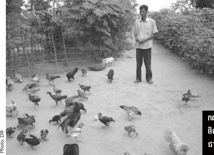
កសិករព័ទ្ធជុំវិញទិញ ចិញ្ចឹមមាន់ដោយដាំ ជាំរបងវែងវាយ

នៅអ្នកនាំសារលេខមុន ប្រិយមិត្តបានដឹងខ្លះៗរួច ហើយអំពីការជ្រើសរើសពូជមាន់ចិញ្ចឹម និងការ រៀបចំទ្រុង។ ឥឡូវប្រិយមិត្តនឹងយល់អំពីផ្នែក ផ្សេងទៀតដូចជា ការឱ្យចំណី និងការថែទាំ។