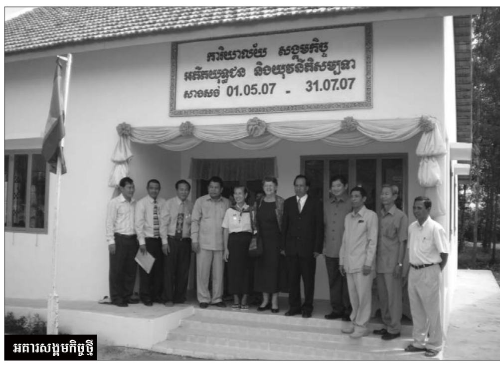
អគារសម្រួលកិច្ច