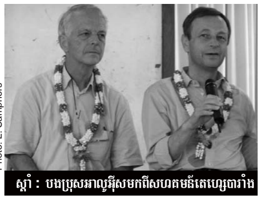
ស្តាំ : បងប្រុសអាឈូអ៊ីសមកពីសហគមន៍តេឡេបារាំង

កាលពីថ្ងៃសៅរ៍ ទី២៩ វិច្ឆិកា នៅព្រះវិហារសន្តយ៉ូសែប យុវជនយុវនារីយ៉ាងកុះករ បានមកចូលរួមសិក្ខាសាលា និងអធិដ្ឋានជាមួយបងប្រុសអាឈូអ៊ីសជាប្រធានក្រុមអ្នកបួនរបស់សហគមន៍តេឡេ នៅប្រទេសបារាំង។ នេះជាលើកទី១៧សម្រាប់ព្រះសហគមន៍កាតូលិកនៅកម្ពុជា ដែលបងប្រុស បានមកធ្វើទស្សនកិច្ច និងលើកទឹកចិត្តដល់យុវជនយុវនារី នៅក្នុងជំនឿរបស់ខ្លួន។ កម្មវិធីធ្វើឡើង ក្រោមប្រធានបទ " ជ្រើសរើសយកក្តីស្រឡាញ់ និងសង្ឃឹម " ។ បងប្រុសអាឈូអ៊ីស បានផ្តល់ថា នេះជាប្រធានបទដែលមានន័យថា វាជាការបញ្ចូលសន្តិភាពដែលព្រះយេស៊ូផ្តល់មកឱ្យយើង។