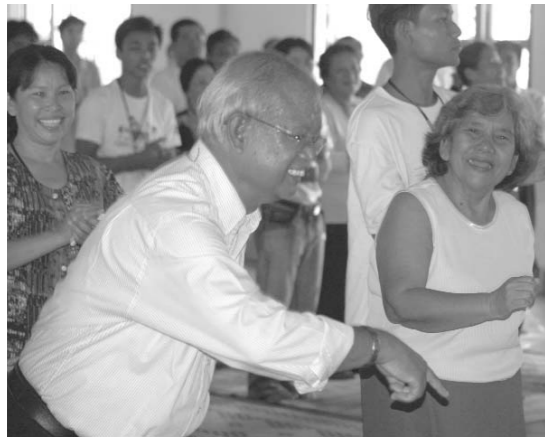
លើឆ្មេង : ការវិនិច្ឆ័យ និង ពិភាក្សានៅតាមក្រុមតូចៗ ទៅលើប្រធានបទនៃអង្គសន្និបាត។ លើ : សមាជិក សមាជិកានៃអង្គសន្និបាតនៅពេលសម្រាកពីអង្គប្រជុំ។ ឆ្មេង : អំព្រាថ្នា អើយ អាណិតលោកតា អាព្រហមធម៌ កុំនាំ គាត់ចាក់ក្បាច់ខ្លាំងពេក !