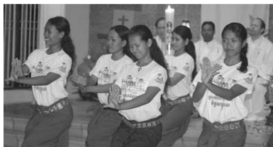
លើឆ្មេង : ក្រុមគណៈកម្មការបាត់ដំបង សង្កែងកាយវិការតាមបទប្បញ្ញត្តិ។ លើ : គណៈកម្មការតំបន់អង្គរសង្កែង ការជួយអ្នកជំងឺ។ ឆ្មេង : របាំប្រជុំជន តាហែន។ ស្តាំ : ការបែកបែកបង្ការ វិស្វកម្មវិញ្ញាណកម្មព្រះសហគមន៍។