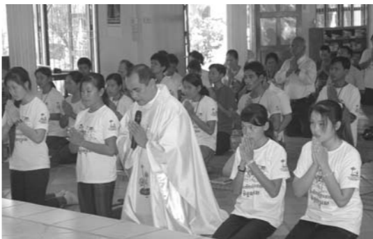
លើ : ពិធីអធិដ្ឋានដង្ហែព្រះកាយព្រះគ្រីស្ទចេញពីអាសនៈ។ ក្រោម : សកម្មភាពចូលរួមលាងចានរបស់សមាជិក សមាជិកា ជាការសង្កែងសម្រាប់ចូលរួមចូលរួមទៅវិញទៅមក។