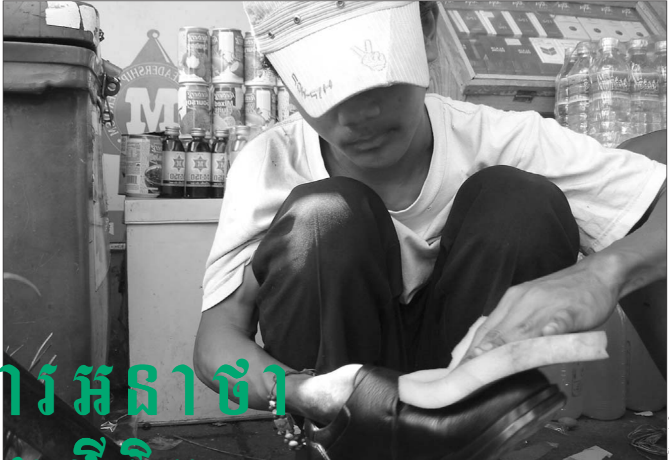
ក្មេងអនាថាជីសាវ៉ាស្បែកជើងរកចំនួនបន្តិចបន្តួចដើម្បីផ្គត់ផ្គង់ជីវភាព