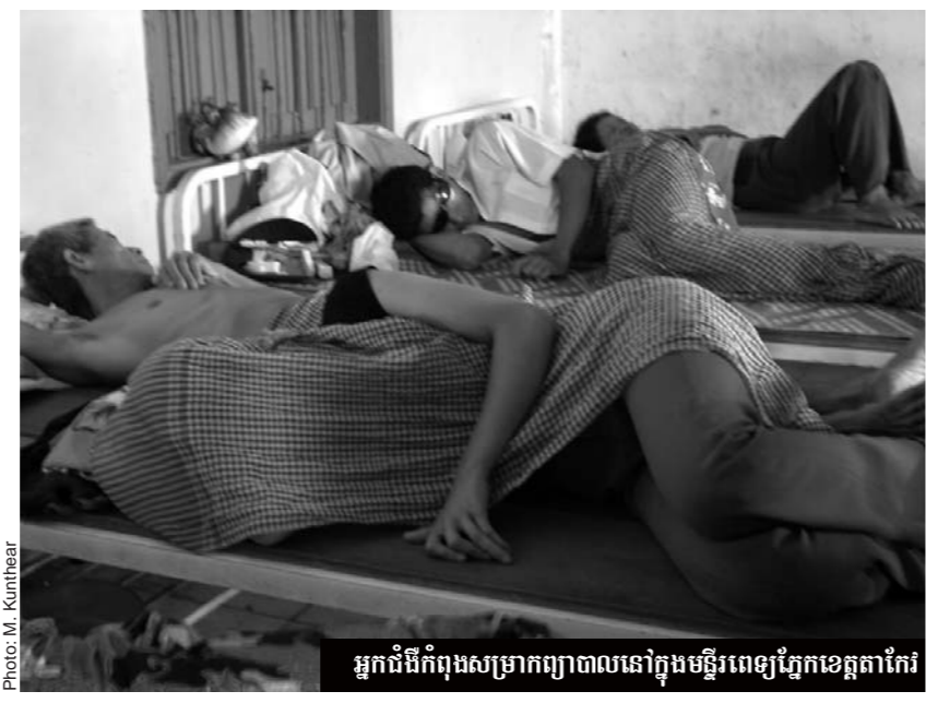
អ្នកជំងឺកំពុងសម្រាកព្យាបាលនៅក្នុងមន្ទីរពេទ្យភ្នែកខេត្តតាកែវ

មានសេវាកម្ម ពិគ្រោះការរក្សា ការផ្តល់នូវការវាស់វែងតា និងការសម្រាកក្រោយពេលរក្សាមានគ្រូពេទ្យជំនាញ ៣នាក់ ជនបរទេសម្នាក់ គិលានុបដ្ឋាយិកា ១៦នាក់ និងជនបរទេសអ្នកសម្របសម្រួលម្នាក់។ មន្ទីរពេទ្យបិតនៅក្នុងស្រុក ម្តងកែវ ខេត្តតាកែវ។