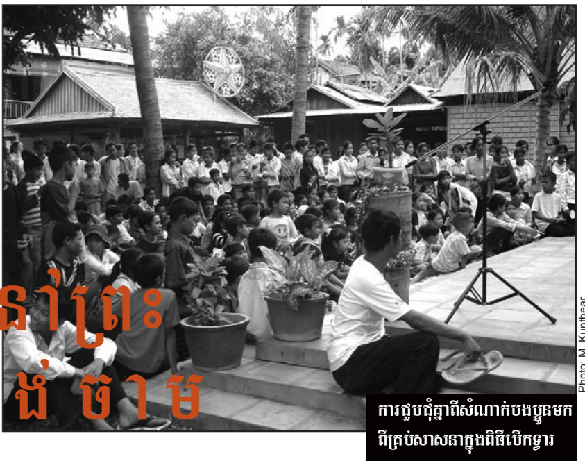
ការរៀបចំបុណ្យពិធីសំណាក់បងប្អូនមកពីគ្រប់សាសនាក្នុងពិធីបើកទ្វារ

ស្របពេលនិងពិធីបុណ្យព្រះយេស៊ូប្រសូត និងជាប្រវត្តិសាស្ត្រមួយសម្រាប់ព្រះសហគមន៍កំពង់ចាម ដែលមានរៀបចំកម្មវិធីមួយ ដែលមិនធ្លាប់មានកន្លងមក។ មនុស្សគ្រប់វ័យរាប់រយនាក់បានចូលមកក្នុងព្រះវិហារកំពង់ចាមដើម្បីប្រារព្ធនូវពិធីនេះ។