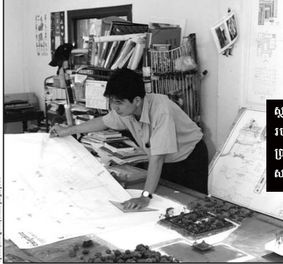
ស្ថាបត្យករកំពុងពិនិត្យប្រោងរបស់រចនាប័ណ្ណសំណង់ដើម្បីឱ្យប្រាកដថាសំណង់នឹងត្រូវបានសាងសង់តាមបច្ចេកសាស្ត្រ

ធ្វើ ដូចម្តេច? យើងត្រូវតែសម្រេចសមត្ថភាពខាងគំនូរ។ យើងអាចរៀនមុខជំនាញនេះនៅតាមគ្រឹះស្ថានឧត្តមសិក្សានានា ដោយការប្រឡងយកអាហាររូបករណ៍ ឬក៏រៀនបង់ថ្លៃ។ មហាវិទ្យាល័យស្ថាបត្យកម្ម នៃសកលវិទ្យាល័យភូមិន្ទវិចិត្រសិល្បៈ។ ទូរស័ព្ទ: ០២៣ ៩៨៦៤១៧។