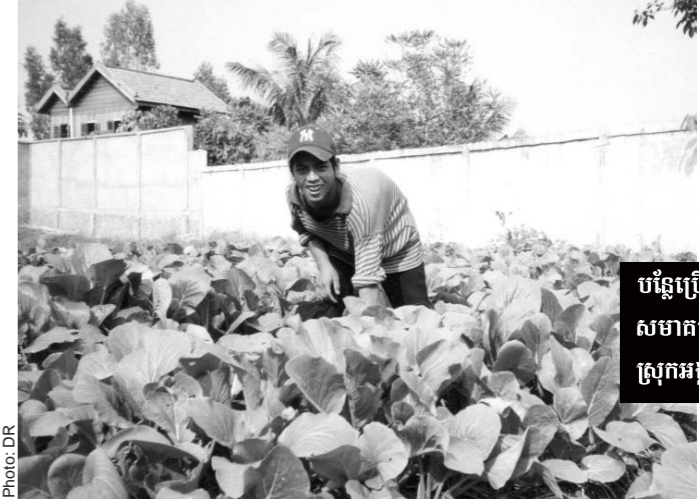
បន្លែប្រើដីអ៊ីអិមរបស់ សមាគមដាំនៅកសិដ្ឋាន ស្រុកអង្គស្នួល-កណ្តាល

ដំណាំត្រូវការដីជាចាំបាច់ដើម្បីកើនទិន្នផលខ្ពស់។ ប៉ុន្តែដីដែលសំខាន់នោះគឺជាដីប្រើប្រាស់យ៉ាងម៉េច? ដែលអាចធ្វើឱ្យការផលិតចំណាយដើមទុនតិច តែ កើនទិន្នផលបានច្រើន និងមិនបំពុលបរិស្ថាននោះ។