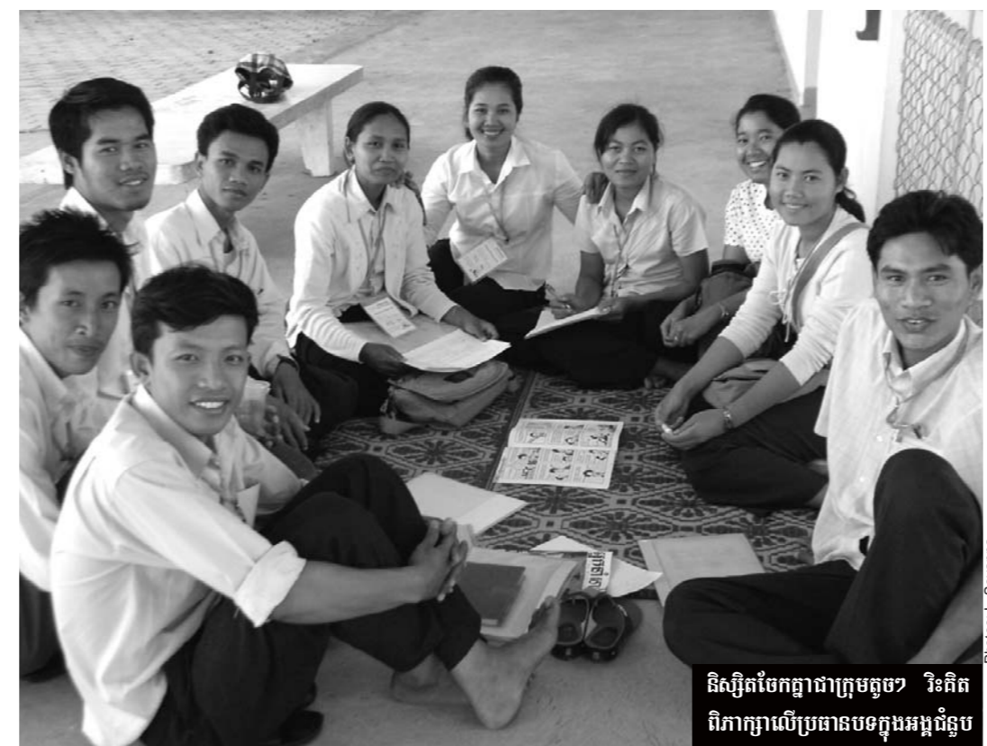
និស្សិតចែកគ្នាជាក្រុមតូចៗ រិះគិត ពិភាក្សាលើប្រធានបទក្នុងអង្គជំនួប