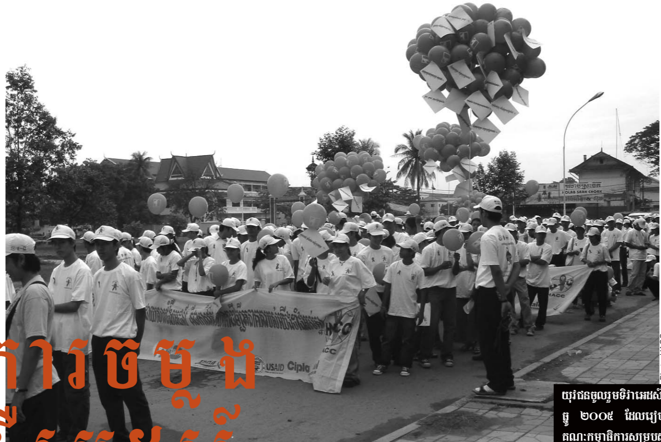
យុវជនចូលរួមទិវាអេដស៍នៅថ្ងៃទី១ ធ្នូ ២០០៥ ដែលរៀបចំដោយ គណៈកម្មាធិការសម្របសម្រួល ប្រយុទ្ធនឹងជំងឺអេដស៍ (HACC)