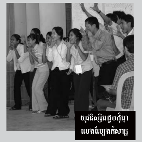
យុវនិស្សិតជួបជុំគ្នា លេងល្បែងកំសាន្ត

អង្គប្រជុំ បានលើកយកប្រធានបទ “យើងរួម គ្នាជាកម្លាំងនៃព្រះសហគមន៍” មកធ្វើការរិះ គិតដើម្បីរំលឹកដល់ យុវនិស្សិតជាគ្រីស្ទបរិស័ទ កាតូលិក។ ហើយនៅលើប្រធានបទនេះ យុវ និស្សិត បានបង្ហាញអំពីទស្សនៈ ដែលខ្លួនចូល ចិត្តព្រះសហគមន៍ និងមុខងាររបស់ខ្លួន ដែល អាចជួយព្រះសហគមន៍បាន។ តាមរយៈការរិះគិតរបស់យុវនិស្សិត នៅក្នុង ក្រុមតូចៗ បានបង្ហាញថា អ្វីដែលធ្វើឱ្យយុវ- និស្សិតយើងចូលចិត្តព្រះសហគមន៍ កើតមាន តាមរយៈសកម្មភាពដូចជា: “សកម្មភាពជួយអ្នកក្រីក្រ ជនពិការ ការផ្តល់ ថ្នាំដល់អ្នកជំងឺ ជួយយុវជនឱ្យបានសិក្សា ការ ជួយទៅដល់អ្នកដទៃដោយមិនមានគិតអំពី សំណង ការបង្រៀនឱ្យចេះស្រលាញ់ និងចេះ លើកទឹកចិត្តអ្នកដទៃ ការផ្តល់គំរូរួមគ្នាតាមរយៈ សកម្មភាពពុំដែលបោះបង់គ្រីស្ទបរិស័ទ មាន អ្នកដឹកនាំល្អរបស់ព្រះសហគមន៍ មកជំរុញ ប្រជាជនទាំងអស់ ទង្វើល្អរបស់គ្រីស្ទបរិស័ទ ចាស់ៗដែលមានជំនឿមាំមួន ជាគំរូដល់យើង ទាំងអស់គ្នា ការផ្សាយដំណឹងល្អមិនបង្ខំគឺជា ការផ្តល់សេរីភាពឱ្យគ្រីស្ទបរិស័ទ ការចេះលើក ទឹកចិត្តអ្នកអស់សង្ឃឹម។ ព្រះសហគមន៍ គឺជា មហាគ្រូសារមួយពោរពេញទៅដោយសេចក្តី ស្រលាញ់ តាមរយៈលោកប្អូនបាទ ហេនរី បងប្រុស បងស្រី និងគ្រីស្ទបរិស័ទទាំងអស់។ ព្រះស-