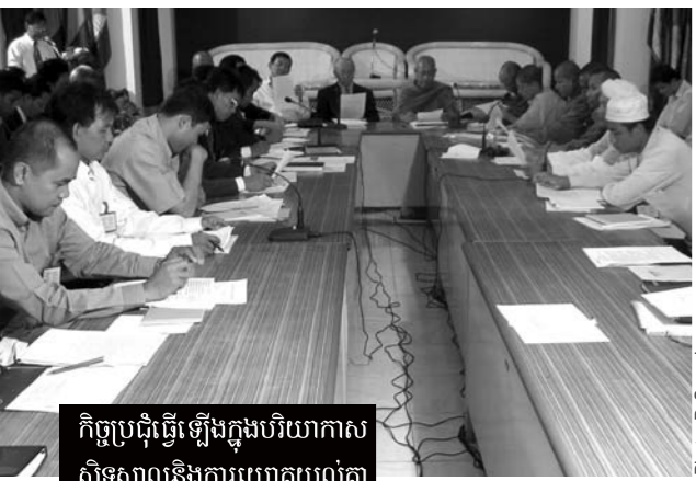
កិច្ចប្រជុំធ្វើឡើងក្នុងបរិយាកាសស្ងៀមស្ងាញ់និងការយោគយល់គ្នា

កិច្ចប្រជុំស្តីពីការ “ពង្រឹងកិច្ចសហប្រតិបត្តិការអន្តរសាសនាដើម្បីសន្តិភាព និងភាពសុខដុមរស់សង្គម” ត្រូវបានរៀបចំឡើងដោយក្រុមប្រឹក្សាអន្តរសាសនាកម្ពុជាកាលពីថ្ងៃអង្គារ ទី៣១ ឧសភា ឆ្នាំ២០០៥។