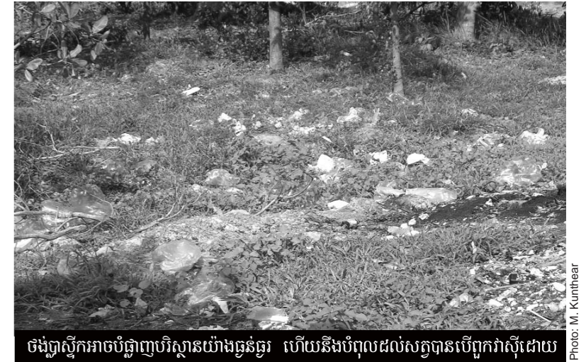
ថង់ប្លាស្ទិកអាចបំប្លាញបរិស្ថានយ៉ាងធ្ងន់ធ្ងរ ហើយនឹងបំពុលដល់សត្វបានបើពួកវាស៊ីដោយ

ជាតិស្មីក្រាមបានផលិតឡើងដោយសារធាតុគីមី ចំរាញ់ចេញពីប្រេង ឧស្ម័ន ធម្មជាតិ និងធូលី។ ភាគច្រើន ជាតិស្មីក្រាមបានផលិតឡើងសំរាប់ធ្វើជាសំភារៈវេចខ្ចប់។ សំភារៈសំរាប់វេចខ្ចប់ គឺប្រើប្រាស់សំរាប់ទុកដាក់ចំណីអាហារ ឱ្យនៅស្រស់ៗ និងការពារផលិតផលកុំឱ្យខូច មានដូចជា ដបប្លាស្ទិក និងថង់ប្លាស្ទិកជាដើម។ ប្រហែលមួយភាគបីនៃសំណល់តាមផ្ទះ ដែលមនុស្សបង្កើតឡើងគឺជាសំភារៈវេចខ្ចប់។ នៅពេលដែលគេទិញសំភារៈ ឬផលិតផលផ្សេងៗពីផ្សារទៅដល់ផ្ទះ គេតែងតែបោះចោលសំភារៈវេចខ្ចប់ទាំងនោះ។ សំភារៈទាំងឡាយសំរាប់វេចខ្ចប់ ដែលមនុស្សប្រើប្រាស់តែម្តងហើយបោះចោលហៅថា "ផលិតផលប្រើហើយបោះចោល"។ សំភារៈវេចខ្ចប់ដែលផលិតឡើងពីជាតិស្មីក្រាម គឺជាបញ្ហាដ៏ធំមួយប៉ះពាល់ដល់បរិស្ថានពីព្រោះ : វាជាផលិតផល ដែលមិនងាយនឹងរលាយបានហើយត្រូវស្ថិតក្នុងបរិស្ថានយូរអង្វែង តទៅមុខ។ មិនត្រឹមតែប៉ុណ្ណោះ នៅពេលដែលយើងដុតវា ផ្សែងវានឹងបញ្ចេញសារធាតុគីមីម្យ៉ាងទៅក្នុងអាកាស ដែលជាហេតុបណ្តាលឱ្យមានការបំពុលខ្យល់។ នៅប្រទេសកម្ពុជាមានប្រជាជនប្រហែល ១២លាននាក់ ប្រសិនបើគ្រប់គ្នាប្រើថង់ប្លាស្ទិកក្នុងមួយថ្ងៃនោះ វាគឺជាចំនួនដ៏ច្រើនបំផុតដែលទៅថ្ងៃអនាគតនឹងមានថង់ប្លាស្ទិកនៅពេលពេល។ Osмосe