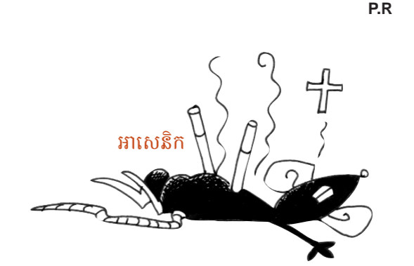
ការបោសម៉ូណូអុកស៊ីត

ការគ្រប់គ្រង មិនមែនជាផ្លូវមួយដ៏ល្អទាល់តែសោះ ទោះបីបារីត្រូវបានគេលក់ដោយសេរីក្តី។ កុំភ្លេចថា! និយមន័យនៃគ្រឿងញៀនគឺថា គេមិនអាចអត់វាបានឡើយ។ ដក់បារីធ្វើឱ្យអ្នកដក់នឹងក្លាយខ្លួនទៅជាជន ដែលរស់នៅដោយមិនឯករាជ្យ ព្រមទាំងគ្មានសេរីភាពផងដែរ។ សារធាតុពិសពុលបំផុតដែលមាននៅក្នុងបារីមួយដើម អាសេនិក ជាជាតិពុលខ្លាំង ឃើញមានក្នុងសាកសពកណ្តុរ។ Goudron កើតមានឡើងពេលអុជបារី។ វាជាសារធាតុផ្សំនៅក្នុងកៅស៊ូក្រាលថ្នល់។ នៅពេលវាចូលទៅដល់សួត វាអាចបំបែររូលកោសិកាសរីរាង្គ រហូតបង្កើតបានជាជំងឺមហារីក។ ជាតិពុលអាសេនិក គេអាចឃើញមាននៅក្នុងផ្សែងចេញពីថយន្ត។ នៅក្នុងរាងកាយ វារាំងស្ទះដល់ដំណើរដឹកជញ្ជូនអុកស៊ីសែននៃគ្រាប់ឈាមក្រហម បង្កើតបានជាជំងឺសរសៃឈាមបេះដូង។ នីកូទីន ជាជាតិគីមីញៀនដែលធ្វើឱ្យអ្នកដក់បារីនៅតែចង់ដក់បារី។ អាសេតូន គឺជាជាតិគីមីប្រើសំរាប់សំអាត ឬលាបផ្ទះ។ ការបំភាយរបស់វាបញ្ចេញនូវជាតិពិសពុលខ្លាំងណាស់។