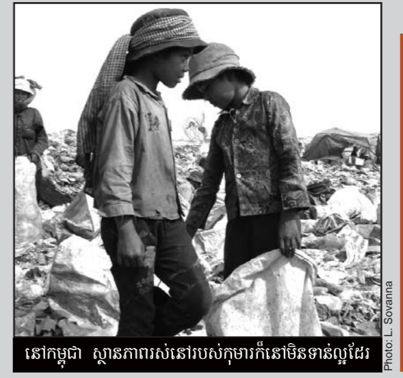
នៅកម្ពុជា ស្ថានភាពរស់នៅរបស់កុមារក៏នៅមិនទាន់ល្អដែរ

អង្គការ Unicef ដោយត្រូវបានគេបង្កើតឡើងនៅក្នុងឆ្នាំ១៩៤៦ និងមានវត្តមាននៅជាង ១៦០ប្រទេស ជុំវិញពិភពលោក អង្គការនេះទទួលបន្ទុកខាងការពារសិទ្ធិកុមារ។ ស្លាការនៅរាជធានីភ្នំពេញសូមទាក់ទងតាមទូរស័ព្ទ: ០២៣ ៨២៦២១៤-៥។