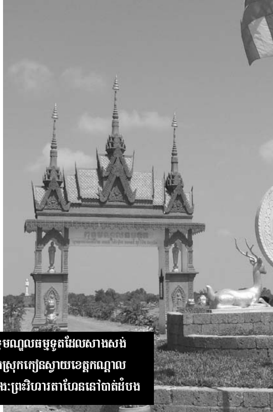
ពុទ្ធមណ្ឌលធម្មទូតដែលសាងសង់ ក្នុងស្រុកកៀនស្វាយខេត្តកណ្តាល ឆ្វេង៖ព្រះវិហារតាហែននៅចាត់ដំបង

សព្វថ្ងៃ សង្គមកម្ពុជាកំពុងមានការវិវត្តន៍ទៅរកទាំងផ្លូវវិជ្ជមាន និងផ្លូវអវិជ្ជមាន។ អ្វីដែលគួរឱ្យបំផុតនោះ គឺយុវជនភាគច្រើនកំពុងប្រឈមមុខ នឹងបញ្ហាសង្គម មានដូចជា កង្វះការអប់រំ ភាពគ្មានការងារធ្វើ កំណើនបទល្មើស និងក្រុមបងពុំសំរាប់បញ្ហាទាំងនេះ តើសាសនានៅក្នុងប្រទេសកម្ពុជាអាចឆ្លើយតបបានអ្វីខ្លះ?