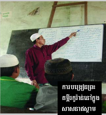
ការបង្រៀនព្រះ គម្ពីរកូរ៉ាន់នៅក្នុង សាសនាឥស្លាម