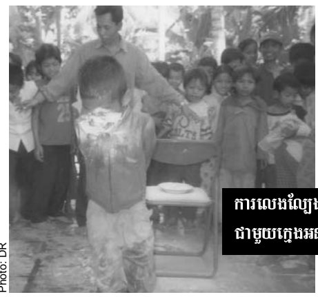
ការលេងល្បែងកំសាន្ត ជាមួយក្មេងអនាថា

បំរើការក្នុងប្រទេសក្រីក្រ ដូចជាប្រទេស កម្ពុជាជាដើម។ នេះគឺជាឱកាសមួយសំរាប់ ជួយលើកទឹកចិត្តដល់និស្សិតទេវវិទ្យាល័យ កម្ពុជាឱ្យបន្តការខិតខំជួយកសាងព្រះសហ គមន៍និងដើម្បីឱ្យស្ពាន់គ្នាទៅវិញទៅមក។ ព្រះសហគមន៍នៅកម្ពុជាមានសេចក្តីសង្ឃឹម ថា នៅពេលអនាគត នឹងមានបូជាចារ្យខ្លីៗ ដែលចេញពីព្រះសហគមន៍ខ្មែរ។ ការជួបជុំ គ្នាជាលើកដំបូងរវាងនិស្សិតទេវវិទ្យាល័យ នៅកម្ពុជានេះគឺការប្រជុំរៀនរៀនរៀនរៀនរៀនរៀន ហើយយើងតាំងចិត្តនឹងធ្វើតាមការរៀបចំ របស់នាយកទេវវិទ្យាល័យភ្នំពេញ។ អេរវ៉ាន់