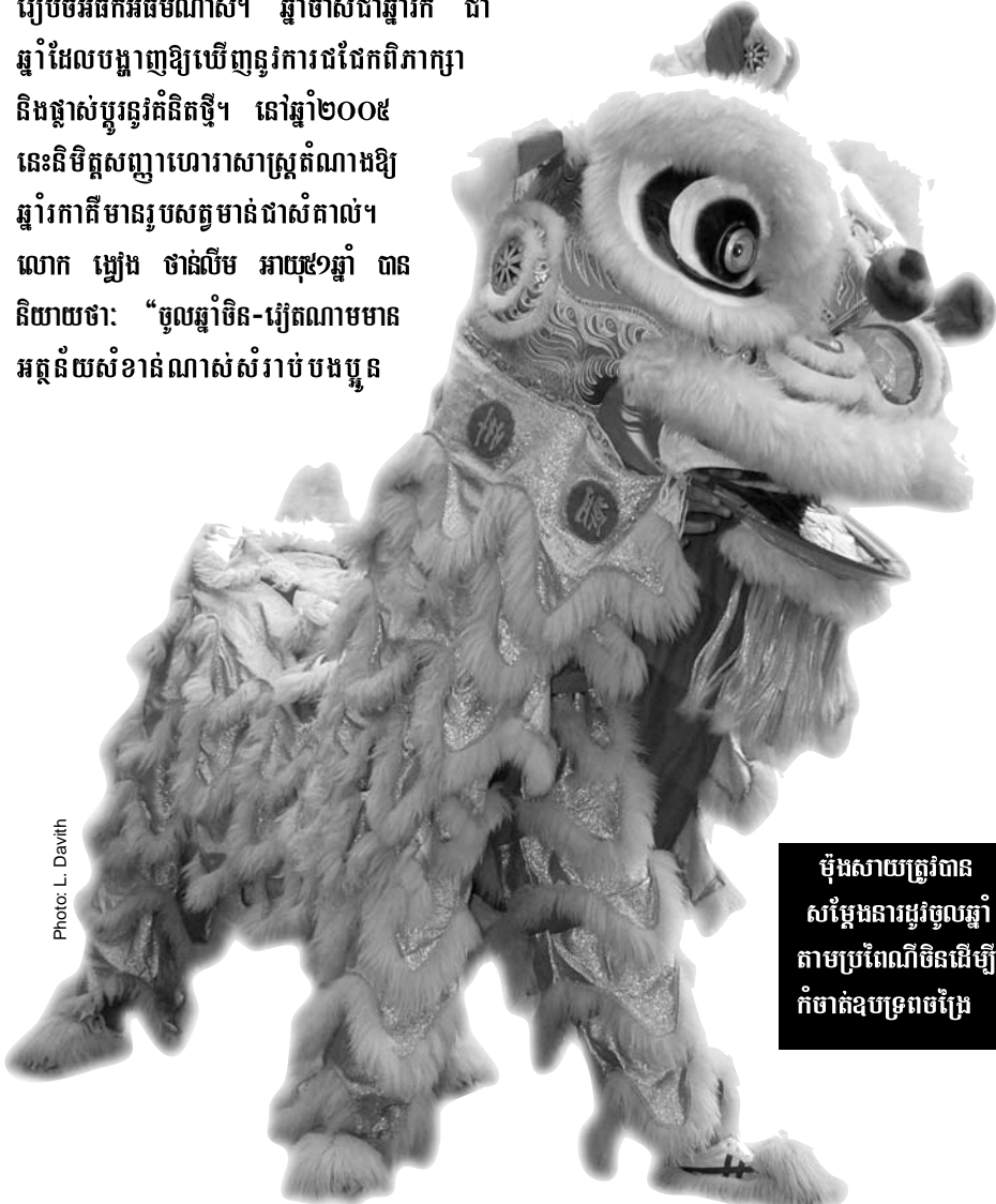
ម៉ុងសាយត្រូវបាន សម្តែងនារប្រពៃណីចិនដើម្បី កំចាត់ឧបទ្រពចង្រៃ

ការរៀបចំផ្ទះសំបែងសំរាប់ស្លាកមន៍ឆ្នាំថ្មី មាន សារៈសំខាន់ណាស់។ គេតុបតែងផ្ទះទៅដោយ ក្រដាសពណ៌ទឹកមាស និងពណ៌ក្រហមជាមួយ ដឹងភ្លើងអំពូលចំរុះពណ៌។ លើសពីនេះកិច្ចការផ្ទះ ត្រូវបានហាមប្រាមមិនអោយធ្វើ។ រីឯអំពោស ត្រូវយកទៅលាក់ទុកមួយកន្លែង ខ្លះខ្លះក្រែងលោ ភ័យសំណាងរសាត់តាមការបោសសំអាតផ្ទះ។ ផ្ទុយទៅវិញ សំរាប់គ្រួសារអ្នកស្រី លោង ស្រីពុំ មានលទ្ធភាពរៀបចំពិធីបុណ្យចូលឆ្នាំឱ្យអ្នកតាម ប្រពៃណីឡើយ។ មុខរបរធ្វើក្រចករបស់គាត់ពុំ បានផ្តល់ជីវភាពធូរធារឱ្យគាត់ឡើយ។ គាត់បាន និយាយថា: “ឥឡូវនេះ យើងមិនអាចធ្វើឱ្យអ្នក