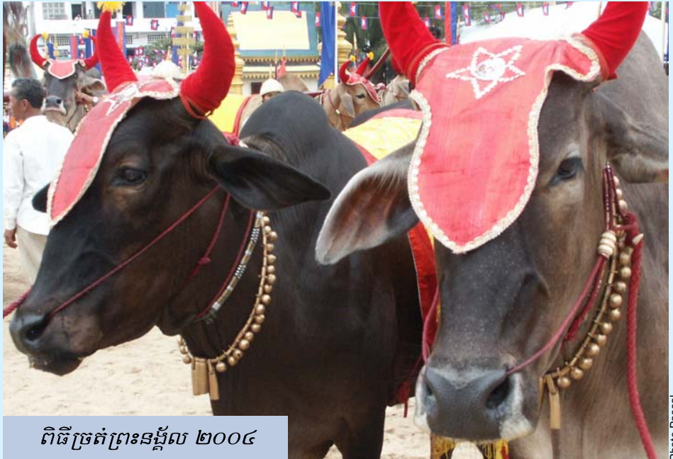
ពិធីច្រត់ព្រះនង្គ័ល ២០០៤