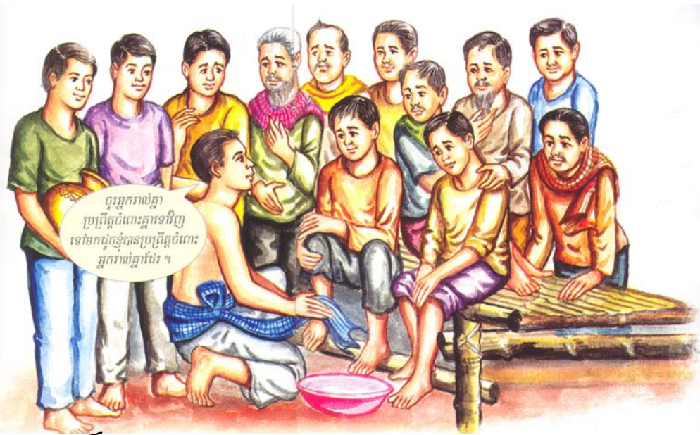
ចូរអ្នករាល់គ្នា ប្រព្រឹត្តចំពោះគ្នាទៅវិញទៅមកដូច្នោះប្រព្រឹត្តចំពោះអ្នករាល់គ្នាដែរ ។

ហេតុអ្វី បានជាយើងត្រូវដាក់ខ្លួនជាអ្នកតូចតាចចំពោះមនុស្សគ្រប់រូបដូច្នោះ ? នេះមិនមែនជាការប្រៀបធៀប រវាងមនុស្សពីរនាក់នោះទេ ប៉ុន្តែ ជារបៀបប្រុងប្រយ័ត្នមួយ ព្រោះបើយើងមិនធ្វើការត្រួតពិនិត្យទៅលើខ្លួនយើងទេ ពេលនោះ យើងមិនខុសអ្វីពីប៉េងប៉ោង ដែលត្រូវមន្ត្រីហោះទៅលើ និងនឹកស្មានថា ខ្លួនល្អប្រសើរជាងអ្នកដទៃទាំងអស់ ។ " ក្នុងចំណោមអ្នករាល់គ្នា អ្នកដែលធំជាងគេ ត្រូវធ្វើតូចជាងគេហើយ អ្នកដែលដឹកនាំគេត្រូវបម្រើគេ" ចូរយើងរស់នៅជាមួយ "អ្នកដទៃ" កុំរស់នៅសម្លឹងមើលតែខ្លួនឯង គិតតែពីខ្លួនឯងចាប់អារម្មណ៍ខ្លួនខ្លាយតែពីខ្លួនឯង បម្រើតែខ្លួនឯង ..សរុប