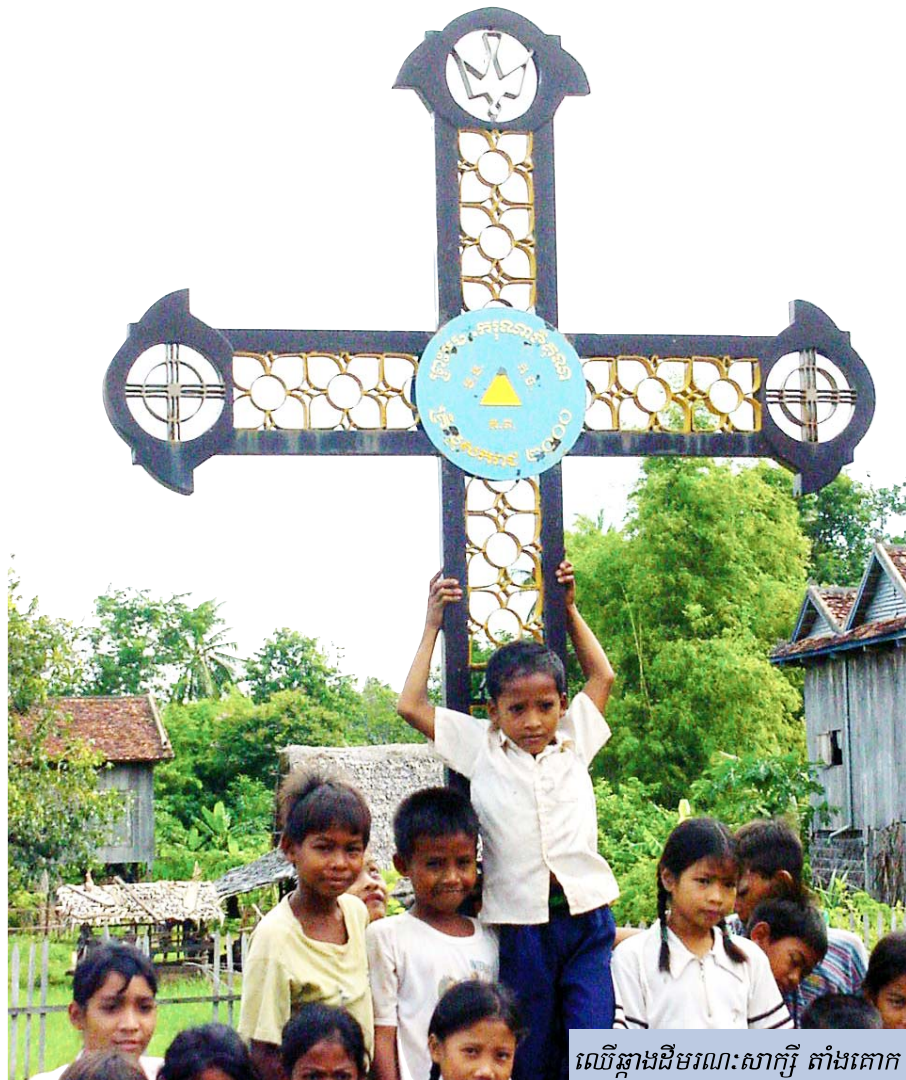
លើឆ្នាំងដីមរណៈសាក្សី តាំងគោក

សម័យ ប៉ុលពត-ខ្មែរក្រហមតំបន់តាំងគោក បានប្រមូលផ្តុំគ្រិស្តវិស័ទជាច្រើនមកពីទីក្រុងភ្នំពេញ និងកំពង់ធំ ដែលបានទទួលរងទុក្ខរងទោសយ៉ាងវេទនាបំផុត