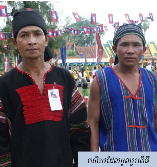
កសិករដែលចូលរួមពិធី

ពិសាខ ចៅភ្នាក់ងារក្រុមមេការ ត្រូវធ្វើ រោងប្រាំ សម្រាប់តាំងពិធីនៅទីព្រះស្រែ (វាលព្រះមេរុខាងជើងព្រះរាជវាំង) ។ ភ្លេងពិណពាទ្យ លេងកំដរបទបួងសួង និងសាធុការ ។ លុះដល់ថ្ងៃ មួយរោច ខែពិសាខ ក្រុមព្រាហ្មណ៍បុរោហិតត្រូវទៅ ធ្វើហោមពិធីក្នុងមណ្ឌលទាំងប្រាំនោះ តាមកូនព្រាហ្មណ៍ ។ រោងទាំង ប្រាំនោះ សង់នៅទិស បូព៌ អាគ្នេយ៍ និរតី ពាយព្យ និង ល្អិតសាន ។