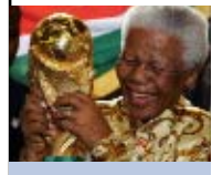
ប្រធានាធិបតី ម៉ង់ដិ ឡា

បាល់ទាត់-វិវ: បុរសស្វាគម ក្រុមស្នើសុំ ធ្វើពានពិភពលោក បាល់ទាត់ ២០១០នៅអាហ្វ្រិក ខាងត្បូង។ ក្រុមនេះបានមក ដល់ប្រទេសអេស្ប៉ាញ (អាហ្វ្រិកខាងត្បូង) នៅព្រឹក ព្រលឹមថ្ងៃអាទិត្យទី ១៦/០៥/០៤ ដោយមាន ការស្វាគមន៍មិនសម្លេងមួយពីវិវ:បុរសរបស់គេ នៅពេលប្រទេសនេះអបអរសាទរការទទួល ធ្វើជាម្ចាស់ផ្ទះកីឡាបាល់ទាត់ពិភព លោកឆ្នាំ