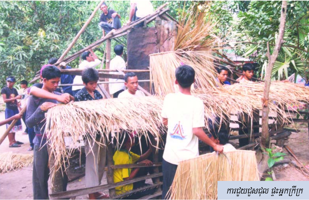
ការជួយជួសជុល ផ្ទះអ្នកក្រីក្រ