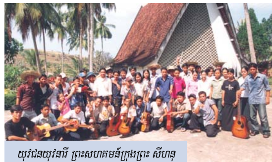
យុវជនយុវនារី ព្រះសហគមន៍ក្រុងព្រះ សីហនុ

នៅថ្ងៃ ខាងមុខ យុវជន យុវនារីនឹងមាន គម្រោង បើកមហាសន្និបាតយុវជននៅព្រះសហគមន៍ ដើម្បីចែករំលែកបទពិសោធន៍ការងារព្រះសហ គមន៍ ក៏ដូចក្នុងជីវិតរស់នៅប្រចាំថ្ងៃរបស់ពួកគេ។ ម្យ៉ាង ការជួបជុំនេះអាចឱ្យពួកគេបានស្គាល់គ្នា