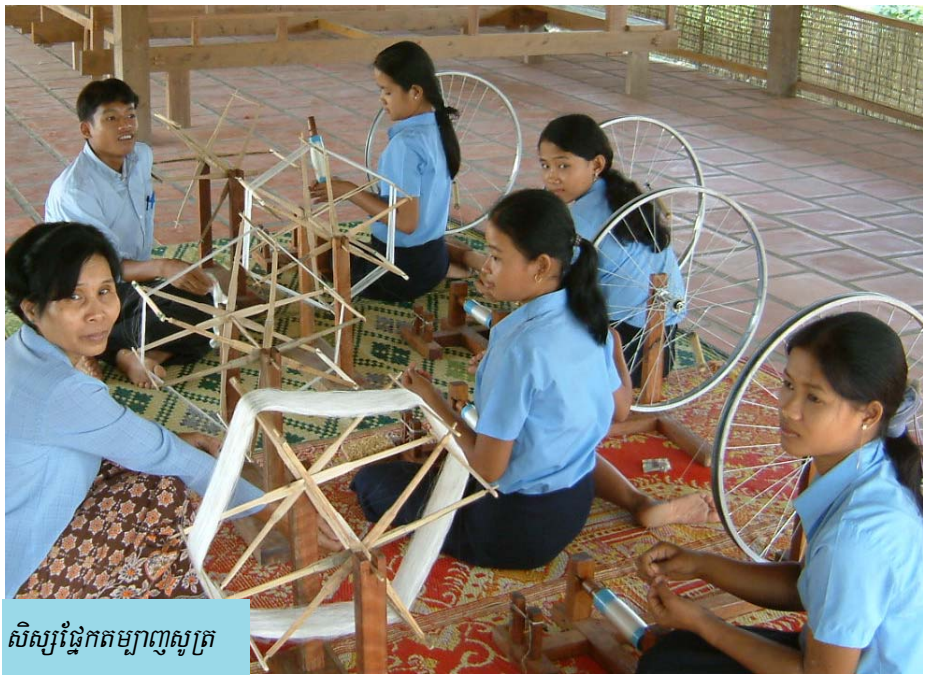
សិស្សផ្នែកតម្បាញសូត្រ

កម្មវិធីនេះ បានបញ្ចប់ទៅប្រកបដោយបរិយាកាសសប្បាយរីករាយ និងការប្រកាសឱ្យប្រើប្រាស់ជាផ្លូវការវិទ្យាល័យសន្តប្រុងស្ងួរដែលជាសមិទ្ធិផលសម្រាប់ជួយអ្នកជនបទឱ្យមានទាំងចំណេះដឹងទូទៅ និងជំនាញ (ផ្នែកលេខាធិការ កសិកម្ម តម្បាញសូត្រ កុំព្យូទ័រ និងភាសា) ស្របតាមប្រព័ន្ធក្រសួងអប់រំយុវជន និងកីឡារបស់ប្រទេសកម្ពុជា យើង ។