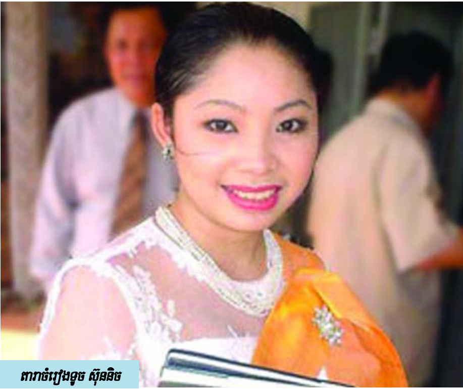
ពារចំរៀងទូច ស៊ុននិច

ព្រះបន្ទូលរបស់ព្រះជាម្ចាស់ពន្យល់ពីអំពើបាបដើមដំបូងក្នុងអត្ថបទព្រះគម្ពីរកំណើតពិភពលោកត្រង់ជំពូកទី៣នៅក្នុងរឿងនិទាន”មនុស្សប្រុសមនុស្សស្រីដើមដំបូង ” ។ ត្រង់នេះ ព្រះជាម្ចាស់បានហាមប្រាមគេទាំងពីរនាក់កុំឱ្យបរិភោគផ្លែឈើមួយដើមដែលដុះនៅចំកណ្តាលសួនឧទ្យាន ។ ក្នុងពេលនោះដែរមានសត្វពស់មួយក្បាលបានមកល្បួងពួកគេដោយពោលថា: ” ថ្ងៃណាមួយពេលដែលអ្នកបរិភោគផ្លែឈើនេះ ភ្នែកអ្នកនឹងបានភ្លឺដូចព្រះដែលស្គាល់ស្គាល់អាក្រក់ជាមិនខាន ” (កំណើតពិភពលោក ៣.៥) ។ ព្រះបន្ទូលនេះបានចង្អុលបង្ហាញពីដើមកំណើតនៃអំពើបាបនៅក្នុងជម្រៅដួងចិត្តមនុស្សយើងដែលមានបំណងលោភលន់ចង់ធ្វើធំដូចព្រះជាម្ចាស់ព្រមទាំងចង់កំណត់ដោយខ្លួនឯងអ្វីជាអំពើល្អ និងអ្វីជាអំពើអាក្រក់ ។ នៅពេល