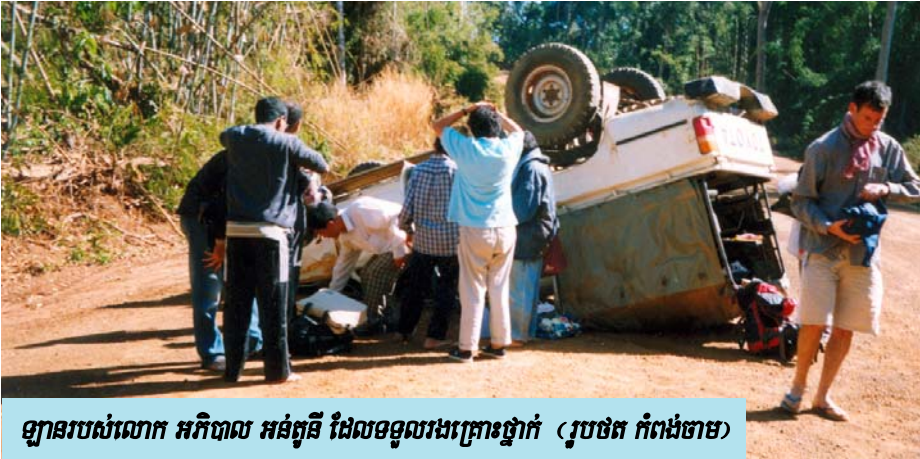
ឡានរបស់លោក អភិបាល អន់តូនី ដែលទទួលរងគ្រោះថ្នាក់

ទាំងអស់១០នាក់ ក្នុងនោះមានលោកអភិបាល លោកបូជាចារ្យ បងស្រី និងគ្រិស្ត បរិស័ទផងដែរ។ ឧបទ្វីហេតុនេះ កើតឡើង នៅពេលធ្វើដំណើរហួសស្រុក កែវសីម៉ា ត្រង់ ចំណុចផ្លូវបត់មួយបណ្តាលឱ្យឡានបែកកង់ (កង់ស្តាំខាងក្រោយ) ក្រឡាប់លើផ្លូវជាតិ។