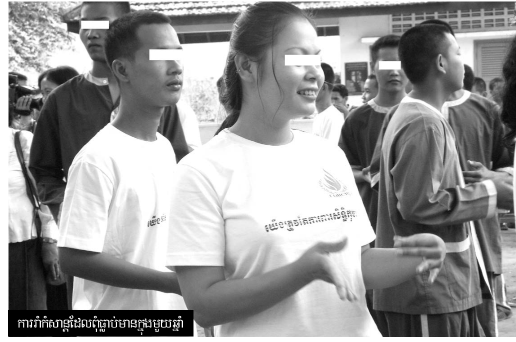
ការរាំកំសាន្តដែលបញ្ចប់មានក្នុងមួយឆ្នាំ

ការឱ្យបត់គ្នា... មានការត្រួតពិនិត្យយ៉ាងខ្លាំងពីសំណាក់ក្រុមគ្រួសាររបស់អ្នកទោសនៅគ្រប់ពន្ធនាគារថា “មានការលំបាកណាស់ក្នុងការចូលសួរសុខទុក្ខក្នុងសណ្ឋានព្រោះត្រូវបង់លុយកាក់រាល់ពេល”។ នេះជាបញ្ហាមួយដ៏ធ្ងន់ធ្ងរសម្រាប់គ្រួសារក្រីក្រ។