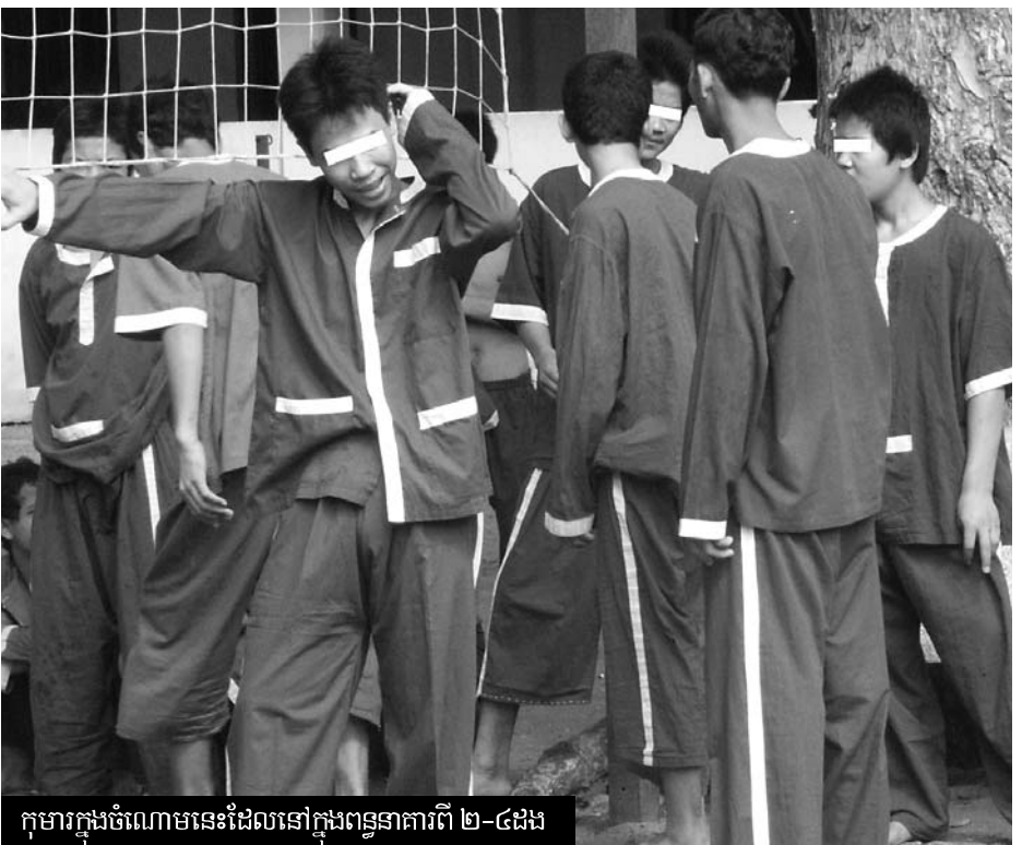
កុមារក្នុងចំណោមនេះដែលនៅក្នុងពន្ធនាគារពី ២-៤ ដង