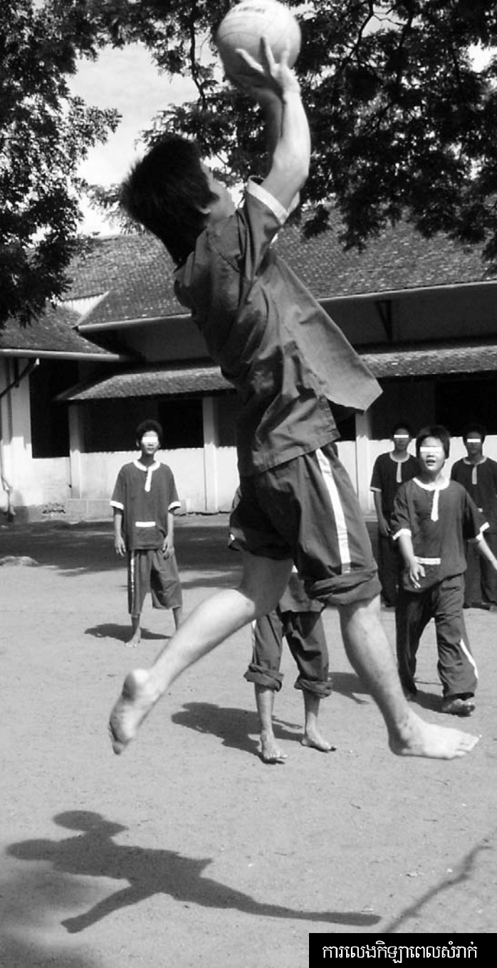
ការលេងកីឡាពេលសំរាក

បានបន្ថែមទៀតថា "ឥឡូវនេះយើងកំពុងមានបញ្ហានិងអគ្គិសនី ជំពាក់គេជាង ៤៤ លានរៀល គឺសម្រាប់បំភ្លឺតែពេលយប់ប៉ុណ្ណោះ។ ចំពោះប្រាក់បៀវត្សបុគ្គលិកវិញ បីបួនខែមិនទាន់បើកម្តង"។