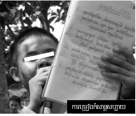
ការប្រៀនកំសាន្តសប្បាយ

ការឱ្យបត់គ្នា... មានការត្រួតពិនិត្យយ៉ាងខ្លាំងពីសំណាក់ក្រុមគ្រួសាររបស់អ្នកទោសនៅគ្រប់ពន្ធនាគារថា “មានការលំបាកណាស់ក្នុងការចូលសួរសុខទុក្ខក្នុងសណ្ឋានព្រោះត្រូវបង់លុយកាក់រាល់ពេល”។ នេះជាបញ្ហាមួយដ៏ធ្ងន់ធ្ងរសម្រាប់គ្រួសារក្រីក្រ។