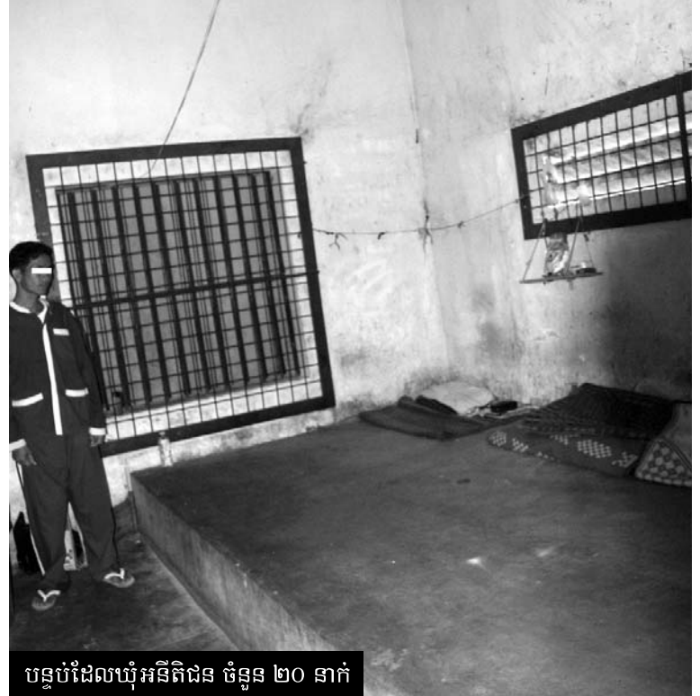
បន្ទប់ដែលឃុំអនិធិជន ចំនួន ២០ នាក់