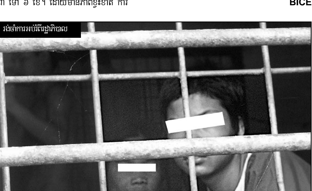
រង់ចាំការអប់រំពីរដ្ឋាភិបាល

ក្នុងករណីបណ្តោះអាសន្នក្តី។ អនីតិជនដែលមានអាយុពី ១៣ ទៅ ១៨ ឆ្នាំ គេមិនអាចឃុំឃាំងក្នុងរយៈពេលហួសពីមួយខែឡើយ លើកលែងតែករណីប្រព្រឹត្តបទឧក្រិដ្ឋ ដែលការដាក់ទោសត្រូវបានធ្វើទេ"។ នៅក្នុងករណីទាំងនេះ ចំនួនដ៏ច្រើននៃអនីតិជនត្រូវបានគេឃុំឃាំងក្នុងរយៈពេលកាន់តែយូរ (យ៉ាងតិចបំផុត ២ ខែ) តាមរបៀបបង្ការជាមុន ហើយអាចត្រូវបានផ្តន្ទាទោស ជាទំងន់ដោយដាក់ពន្ធនាគារ នេះស្ថិតនៅក្នុងលក្ខខណ្ឌមិនអាចទទួលយកបានទេ។ មន្ទីរឃុំឃាំង និងមជ្ឈមណ្ឌលនានា មជ្ឈមណ្ឌលស្ថានីយ៍សម្បទា Youth Rehabilitation Center (YRC) នៅភ្នំពេញ គឺជាមជ្ឈមណ្ឌលអប់រំតែមួយគត់ ដែលផ្តល់ការអប់រំដល់អនីតិជន និងគាំទ្រដោយរដ្ឋាភិបាល។ នៅក្នុងមណ្ឌលមិនអនុញ្ញាតអោយចេញចូលជាសាធារណៈទេ។ មជ្ឈមណ្ឌលនេះបានទទួលក្មេងប្រុសៗមានអាយុពី ៧ ដល់ ១៨ ឆ្នាំ ចំនួន ១២២ នាក់ ដែលស្នាក់នៅពី ៣ ទៅ ៦ ខែ។ ដោយមានភាពខ្វះខាត ការ