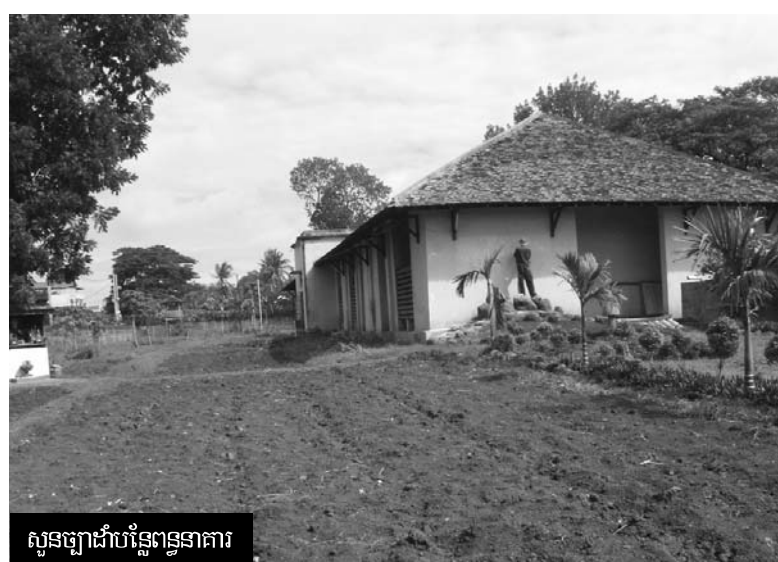
សួនច្បារដំបូងពន្ធនាគារ

លោកអនុប្រធានពន្ធនាគារ (រូបខាងឆ្វេង) មានប្រសាសន៍ថា "លោកក៏ចង់អោយមានកន្លែងពិសេសមួយសម្រាប់អនិធិជនដែរ តែពួកលោក