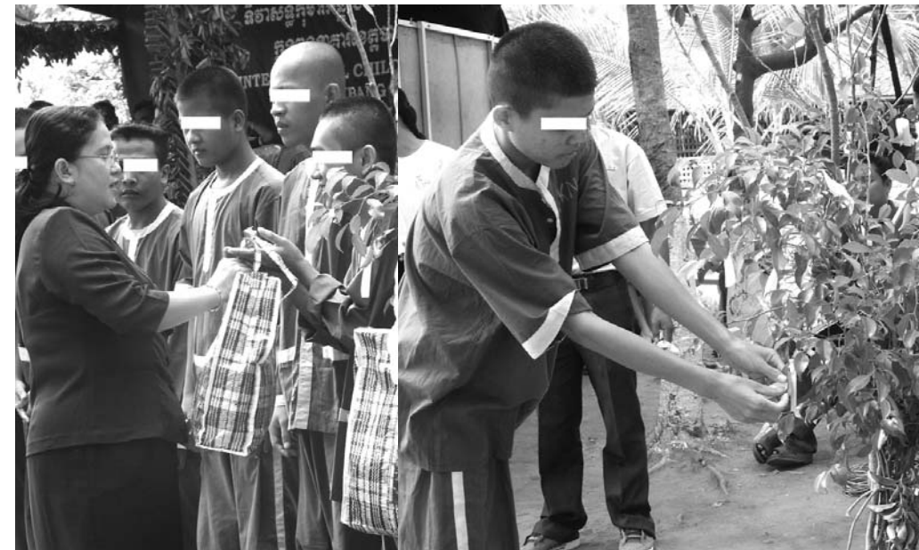
ពិធីចែកអាហាររបស់អង្គការ (PJJ) (KOK) ល្បែងសំនួរ ចំពើយអំពើសិទ្ធិកុមារ ដែលប្អូនៗពិបាកឆ្លើយ មានស្លាកជើង ភ្លុយ...