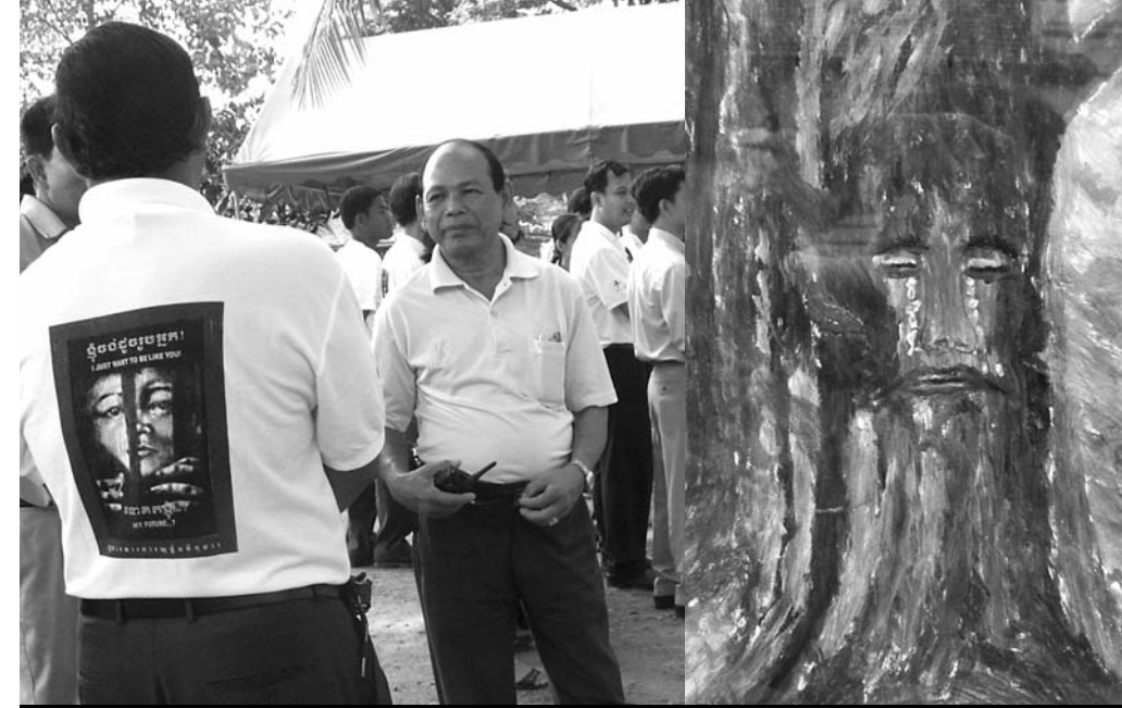
លោកប្រធានពន្ធនាគារ (បែបុខ) និងអង្គការ PJJ គំនូរចំណាត់ថ្នាក់លេខ ១ របស់ទណ្ឌិត

ពន្ធនាគារខេត្តបាត់ដំបងមានពិរទ្ធជន និងទណ្ឌិតចំនួនប្រហែល ៥០០ នាក់ មានកុមារ និងមនុស្សពេញវ័យ។ កុមារនិងមនុស្សពេញវ័យរស់នៅជាមួយគ្នា។ តាមការសាកសួរអ្នកទោស នៅទីនោះមានការអប់រំចំណេះទូទៅ និងកម្មវិធីផ្សេងៗទៀត។ មតិខ្លះនិយាយថា “ទិវាសិទ្ធិកុមារដែលប្រារព្ធនៅថ្ងៃនេះ មានតែមួយថ្ងៃប៉ុណ្ណោះ ប្អូនៗជាទណ្ឌិតដែលមានសេរីភាព និងត្រូវបានគេយកចិត្តទុកដាក់។ ចុះថ្ងៃផ្សេងទៀតប្អូនៗមានសេរីភាព និងត្រូវបានគេយកចិត្តទុកដាក់ដូចថ្ងៃនេះដែរទេ?”