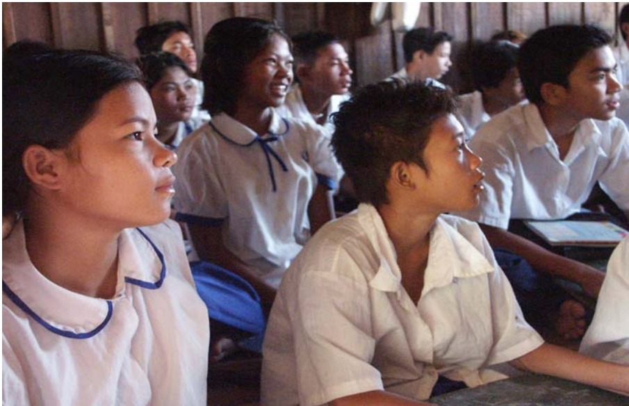
សិស្សបឋមសិក្សានៅមណ្ឌលភាពញញឹមនៃកុមារ

នៅឆ្នាំ ២០០០ អង្គការភាពញញឹម នៃកុមារបានទទួល ការជួយឧបត្ថម្ភពីប្រធានាធិបតីបារាំង និង The Human Rights Prize of the French Republic) នៅក្នុងពេលជាមួយគ្នានេះដែរ គ្រីស្ទីន ក៏បានទទួល ត្រៀមឥស្សរយស ក្រុងភ្នំពេញ និង សិខិតសរសើរពីសំណាក់ សម្តេចនាយករដ្ឋមន្ត្រីនៃព្រះរាជាណាចក្រកម្ពុជាផងដែរ ។ នៅឆ្នាំ ២០០១ ដោយគ្រីស្ទីន (Christain) និង