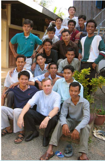
ការជួយយុវជនរិះគិតពីតំលៃជីវិតរបស់ខ្លួន

ឧទាហរណ៍: ក្នុងរឿងពួកហោរាចារ្យក្នុងព្រះគម្ពីរដំណឹងល្អ តែងដោយលោកម៉ាថាយជំពូក ២ ពួកហោរាចារ្យបានឃើញផ្កាយ ហើយពួកគេនាំគ្នាធ្វើដំណើរទៅជួបព្រះជាម្ចាស់ ” ព្រះកុមារយេស៊ូ ដែលផ្តុំក្នុងស្លូកសត្វ ” នោះពិតជាព្រះអំណោយទានមួយមែន ។ ការដើរតាមពន្លឺផ្កាយរាំពុំមែនជាការងាយទេ គេត្រូវធ្វើដំណើរយ៉ាងវែងឆ្ងាយមានឧបសគ្គជាច្រើន តែពួកគេនៅតែទៅមុខជានិច្ចមិនរុញរាសោះឡើយ ។ ចំនុចនេះមានសារៈសំខាន់ណាស់ចំពោះជីវិតរបស់យើងម្នាក់ៗ ដែលកំពុងរំលោភអ្វីមួយ កំពុងទទួលការអប់រំ ឬកំពុងបំពេញកិច្ចការអ្វីមួយ ។ យើងមិនត្រូវបណ្តោយខ្លួនអោយភ្លេចនឹកគិតពីបំណងប្រាថ្នារបស់ខ្លួននោះឡើយ ។ ប្រសិនបើយើងចេះតែបណ្តោយខ្លួន ទៅតាមការនឹកឃើញ ឬទន់ជ្រាយតាមការលំបាកការ