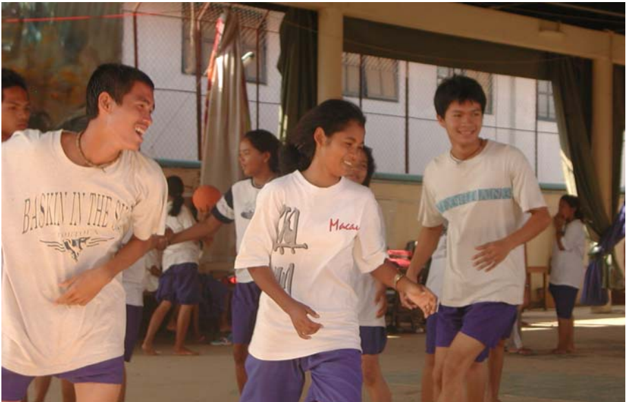
សិស្សនៅមណ្ឌលភាពញញឹមនៃកុមារ ពេលលេងកីឡា

៤-ការអប់រំខាងក្រៅអង្គការ: មានក្មេង ចំនួន ១៣០០ នាក់ក្នុង ៦សាលាផ្សេងគ្នា