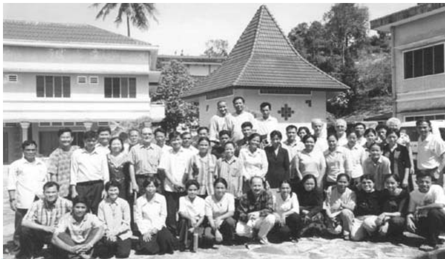
សិក្ខាកាមដែលចូលរួមក្នុងអង្គសិក្ខាសាលា

កាលពីថ្ងៃទី ៨ ខែធ្នូ រហូលដល់ថ្ងៃទី ១២ ខែធ្នូ ឆ្នាំ២០០៣ មានសិក្ខាសាលាទូទាំងប្រទេសមួយនៅក្រុងព្រះសីហនុ គឺស្ថិតនៅក្នុងព្រះវិហារកំពង់សោម ដែលមានសិក្ខាកាមចំនួន ៥០នាក់មកពីភូមិភាគទាំងបី ភូមិភាគភ្នំពេញ ភូមិភាគបាត់ដំបង ភូមិភាគកំពង់ចាម) ។ សិក្ខាសាលានេះបានរិះគិតអំពីប្រធានបទ "ការអប់រំមនុស្សពេញវ័យ" ដោយសង្កត់ធ្ងន់ទៅលើអត្តសញ្ញាណជ្រមុជទឹក ។