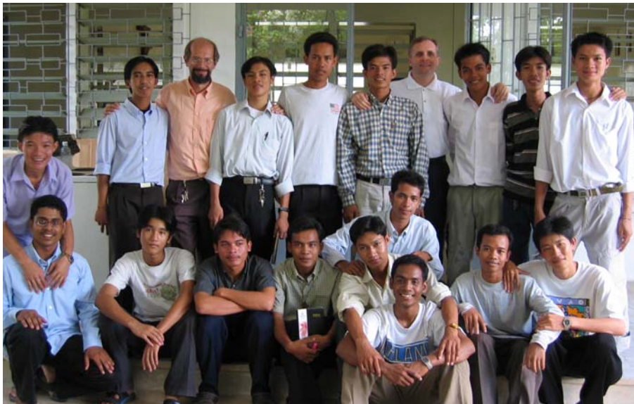
យុវជនសមាជិកក្រុមអេម៉ាលូអែល និង បូជាចារ្យដែលជួយណែនាំ

យើងខ្ញុំមានអំណរសប្បាយ សូមជំរាបបងប្អូនខ្លះៗអំពីក្រុមអេម៉ាលូអែល ។ អេម៉ាលូអែលជាក្រុមមួយដែលត្រូវបានបង្កើតឡើងក្នុងអំឡុងពេលបី រឺ បួនឆ្នាំថ្មីៗនេះ ។ គោលបំណងរបស់ក្រុមអេម៉ាលូអែលគឺញ៉ាំងអោយយើងខ្ញុំ ដែលជាសមាជិកក្រុមរូបរួមគ្នារិះគិតអំពី បញ្ហាជីវិត រួមមានដូចជាសេចក្តីស្រឡាញ់ អំណរសប្បាយ ទុក្ខលំបាកសេរីភាព សោភ័ណភាពពិតលោក វត្តមានរបស់ព្រះជាម្ចាស់ ក្នុងជីវិតរបស់ពួកយើងម្នាក់ៗ រំលឹកជីវិតក្នុងអតីតកាល ... ។ល។ ទាំងអស់នេះជាប្រធានបទខ្លះៗ ដែលយើងធ្លាប់បានរិះគិត និង បន្តរិះគិតជាមួយគ្នាក្នុងក្រុមអេម៉ាលូអែល ។