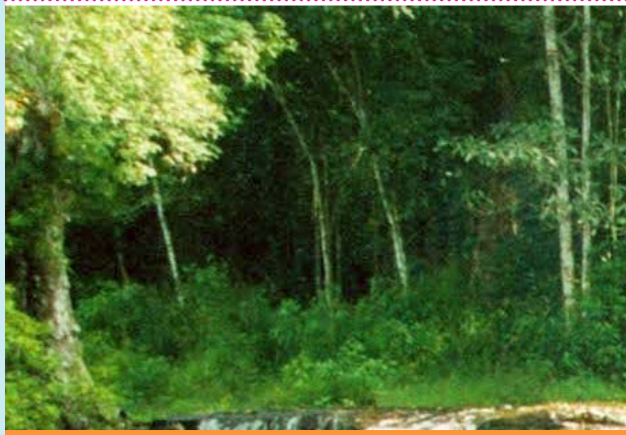
បងស្រី អេមា (រូបកណ្តាល) រួមជាមួយលោកអភិបាល គីតេ និង ក្រុមបងស្រីឧបការៈគុណ