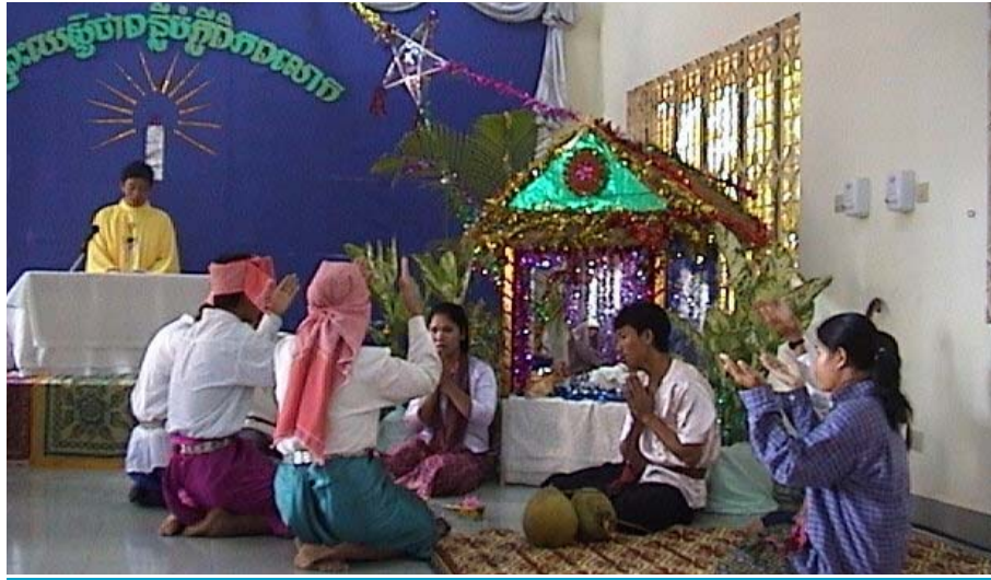
ហោរាចារ្យទាំងបីទៅថ្ងៃយប់ដ៏ព្រះកុមារយេស៊ូ "សំដែងដោយយុវជនកំពង់ចាម"

មនុស្សយើងម្នាក់ៗ ដែលរស់រានមានជីវិតនៅលើលោកនេះ តែងតែមានគោលបំណងយ៉ាងតិចបំផុតមួយ ឬ ជួនកាលច្រើនទៀតផង។ ប៉ុន្តែក្នុងការរស់នៅ និងក្នុងសកម្មភាពប្រព្រឹត្តផ្សេងៗរបស់យើងរៀងរាល់ថ្ងៃជួនកាលនាំមកនូវអំណរសប្បាយជួនកាលនាំមកនូវការព្រួយបារម្ភ ទុក្ខកង្វល់ ឬជួនកាលត្រូវតែចាប់កំហុស។ សេចក្តីទាំងនេះតែងកើតឡើងក្នុងជីវិតរបស់មនុស្សម្នាក់ៗជៀសពុំរួចឡើយ ហើយវាក៏ជារឿងធម្មតាដែរព្រោះជីវិតមានការវិវត្តន៍រីកចម្រើនជារៀងរាល់ថ្ងៃ មិននៅនឹងថ្កល់នោះទេ។ ប៉ុន្តែអ្វីដែលសំខាន់ គឺយើងគួរចេះមើល និងចេះពិចារណានូវគោលបំណងរបស់យើងតើត្រឹមត្រូវ ឬ មិនត្រឹមត្រូវ? ហើយអ្វីដែលល្អ