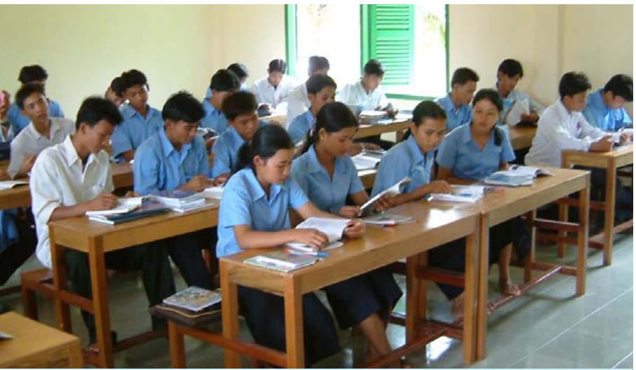
សិស្សសាលាសន្តប្រុងសំរេសារីយេ ( ចំការឡើង)

ហត់នឿយឬឧបសគ្គផ្សេងៗដែលរារាំងផ្លូវនោះយើងពិតជាទទួលបរាជ័យ ហើយមិនអាចសំរេចបំណងប្រាថ្នារបស់យើងជាក់ជាមិនខាន ។ ផ្ទុយទៅវិញការលំបាក ការនឿយហត់ឬឧបសគ្គនោះ ជាបញ្ហាដែលតែងតែកើតឡើងក្នុងជីវិតយើងគ្រប់គ្នា ។ អ្វីដែលសំខាន់គឺយើងត្រូវចងចាំជានិច្ចថា ” ព្រះជាម្ចាស់បង្កើតយើង និង ប្រទានអោយយើងមានប្រាជ្ញាចេះដោះស្រាយរាល់បញ្ហាសុភស្តាព្យ និងប្រទានអោយយើងឆ្លងកាត់នូវរាល់ការលំបាកផ្សេងៗ ដោយអោយយើងហ៊ានសំរេចចិត្តដោយខ្លួនឯង ដែលមានព្រះវិញ្ញាណជួយណែនាំនិងផ្តល់កំលាំងអោយយើងជានិច្ចសូមកុំខ្លាចអ្វីឡើយ! ចូរបំពេញគ្រប់កិច្ចការដែលត្រូវធ្វើហើយបំពេញកិច្ចការដែលអ្នកបានគ្រោងទុកនោះតាមបំណងប្រាថ្នាដោយក្តីស្រឡាញ់ និងដោយក្តីស្មោះត្រង់នោះទៅព្រះជាម្ចាស់នឹងជួយបំពេញបន្ថែមនូវកង្វះខាតរបស់យើងអោយបានកាន់តែប្រសើរលើសពីក្តីត្រូវការរបស់យើងទៅទៀត ។ សូមកុំខ្លាចអ្វីឡើយព្រះជាម្ចាស់គង់នៅជាមួយយើងជានិច្ច ។